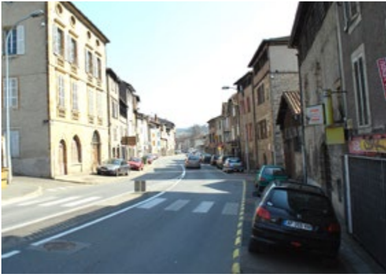
L'avenue avant et après les travaux des trottoirs mis aux normes, des cheminements piétons sécurisés et un stationnement réorganisé