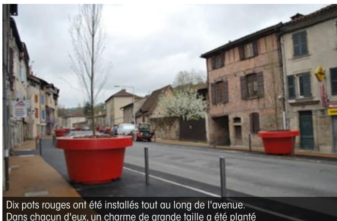
Dix pots rouges ont été installés tout au long de l'avenue. Dans chacun d'eux, un charme de grande taille a été planté

Un choix audacieux validé par l'architecte des Bâtiments de France et les riverains, associés au projet en amont et tout au long des travaux.