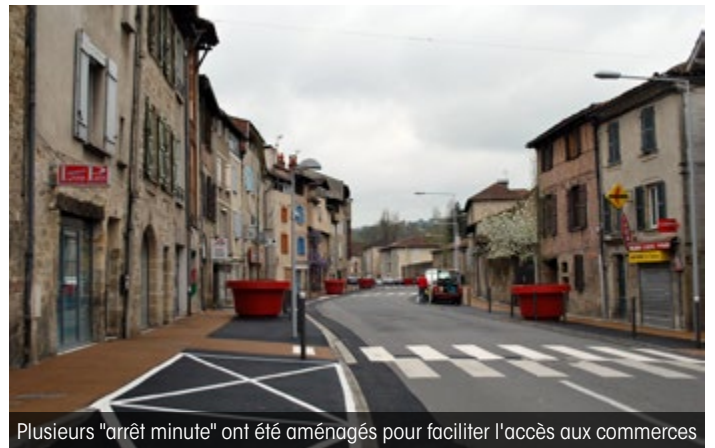
Plusieurs "arrêt minute" ont été aménagés pour faciliter l'accès aux commerces

Après les avenues Philibert Delprat et Julien Bailly, c'est la troisième entrée de ville à faire peau neuve. Le chantier s'est déroulé en plusieurs phases : tout d'abord la mise en conformité du réseau gaz, suivi de la consolidation des ouvrages de l'ancien canal, et pour finir l'aménagement des trottoirs, la sécurisation des cheminements piétons et la réorganisation du stationnement.