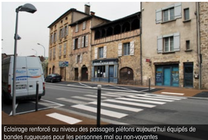
Eclairage renforcé au niveau des passages piétons aujourd'hui équipés de bandes rugueuses pour les personnes mal ou non-voyantes

Afin d'améliorer la circulation des piétons et l'accessibilité pour les personnes à mobilité réduite, les trottoirs ont été mis aux normes (élargis à 1,40 m) et leur dévers rétabli. Du mobilier urbain et une couleur différente choisie pour le revêtement au sol permettent désormais de séparer le cheminement piétonnier de la partie réservée au stationnement. Les passages piétons ont eux aussi été mis aux normes avec l'installation de bandes rugueuses et d'un éclairage renforcé. Côté stationnement, seules quelques places ont été supprimées au profit d'arrêts minute aménagés devant les commerces.