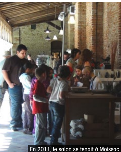
En 2011, le salon se tenait à Moissac