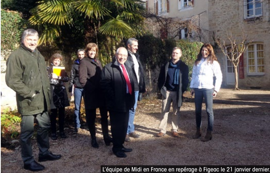
L'équipe de Midi en France en repérage à Figeac le 21 janvier dernier.

Un excellent coup de projecteur sur Figeac et ses environs