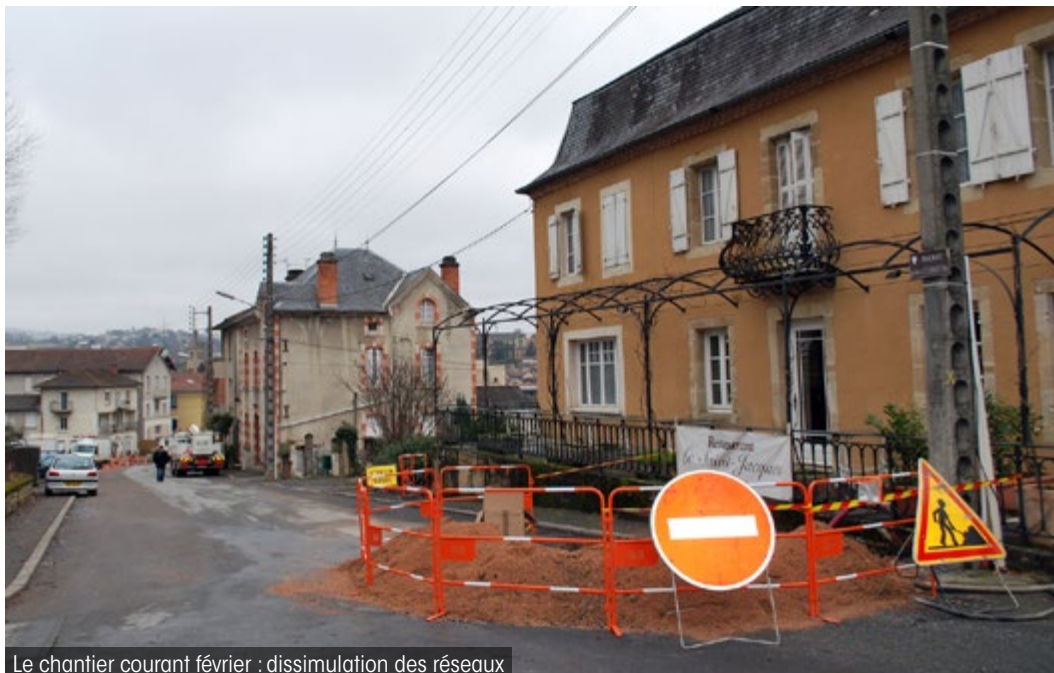
Le chantier courant février : dissimulation des réseaux

La première avenue éclairée à base de leds