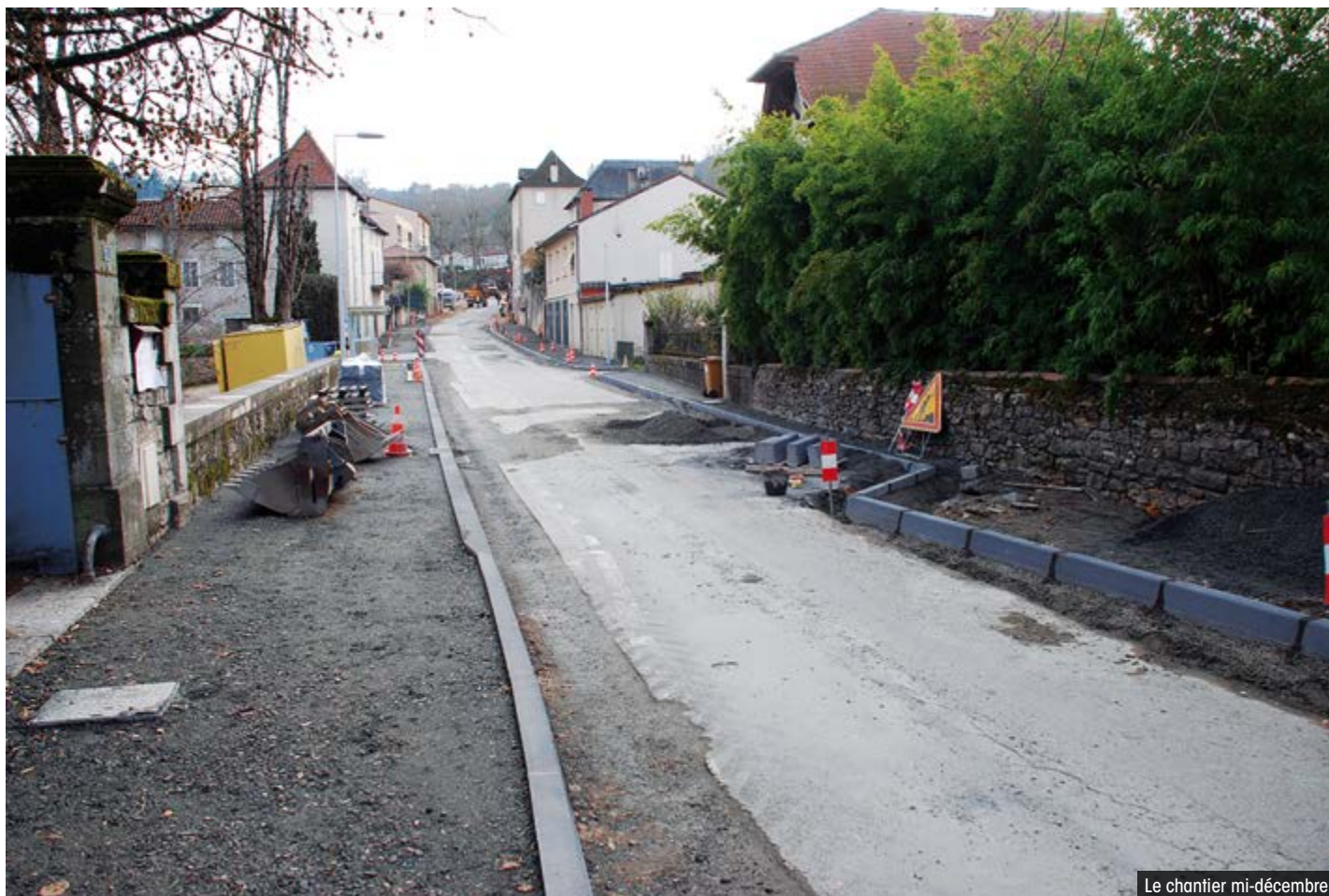
Le chantier mi-décembre

Deux technologies innovantes associées pour réaliser des économies