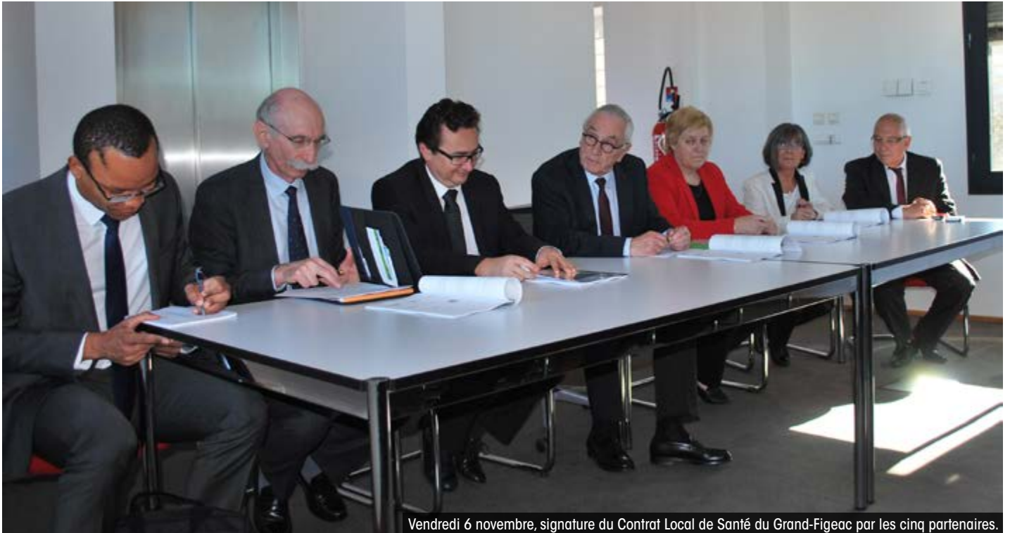
Vendredi 6 novembre, signature du Contrat Local de Santé du Grand-Figeac par les cinq partenaires.

Agir ensemble contre les inégalités sociales et territoriales de santé