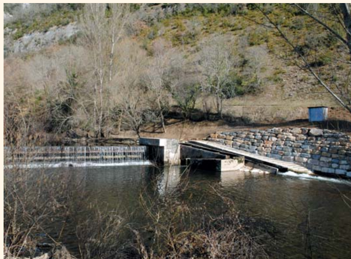
Chemin de portage à Marcilhac-sur-Célé.