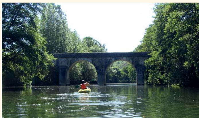
Le canoë, l'une des nombreuses activités pratiquées sur le Célé

Au final, une avancée majeure : la reconquête de la qualité des eaux . Le Célé est aujourd'hui la rivière lotoise qui compte le plus grand nombre de points de baignade comme le disait Martin Malvy lors d'une réunion du syndicat mixte qui a succédé à l'association initiale.