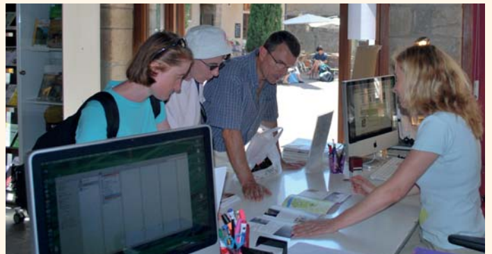
Un réaménagement des locaux destiné à améliorer l'accueil des visiteurs et le confort de travail de l'équipe.

Le rez-de-chaussée sera aux trois quarts dédié au public avec l'aménagement d'une banque d'accueil au centre de la salle sud, des rangements adaptés pour la documentation, une vitrine d'exposition pour la promotion des produits locaux, un mur d'images dédié aux autres Grands Sites, une borne internet et un large espace de détente. Suite au déménagement des