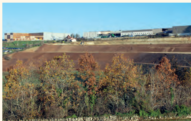
La zone depuis la route de Villefranche-de-Rouergue.

Sur les 5,4 ha aménagés, 3,2 ha sont commercialisables et d'ores et déjà réservés par Figeac-Aéro. Début 2013, les deux premières plateformes seront donc prêtes à accueillir les nouveaux bâtiments industriels de l'entreprise, à propos desquels les discussions avec les services compétents sont d'ores et déjà entamées.