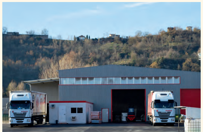
Les nouveaux bâtiments de l'entreprise Miquel sont opérationnels depuis fin octobre.

■ 27 176 € à l'entreprise Miquel Logistique et Services . Autrefois installée sur la zone d'activité de Viviez, en Aveyron, l'entreprise a récemment déménagé son activité et ses infrastructures à Capdenac-Gare sur la zone de la Rotonde, récemment étendue par Figeac-Communauté.