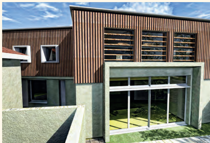
Projet d'extension - perspective sur rue Paul Bert.

Cette opération, d'un montant total de 353 140 € H.T. (dont 195 580 € H.T. de travaux) devrait être financée