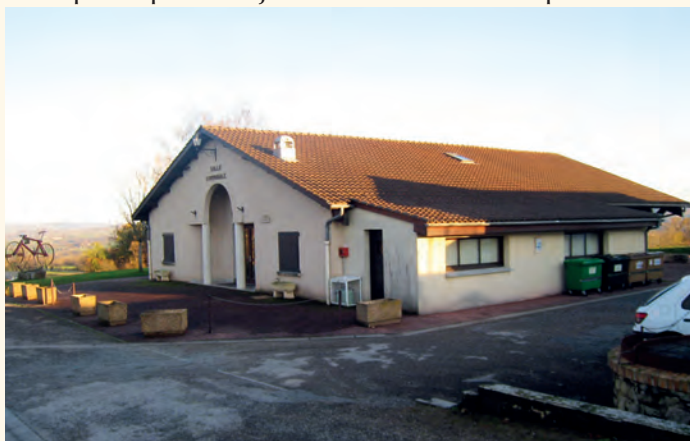
La salle communale et la Mairie.

Les principaux objectifs sont : la recomposition de