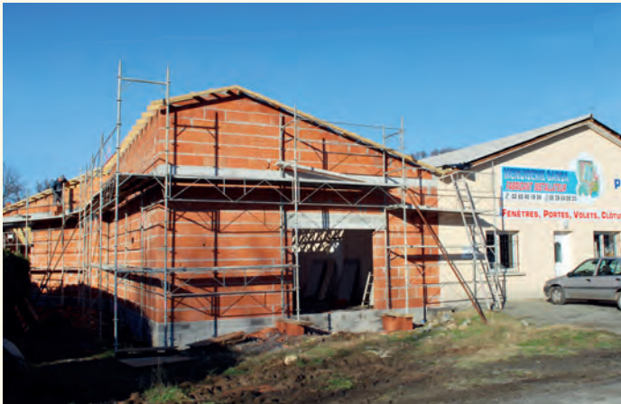
Les travaux d'agrandissement sont en cours.

■ 10 920 € à l'entreprise Ganga , implantée à Bagnac-sur-Célé sur la zone de Larive, qui a bénéficié