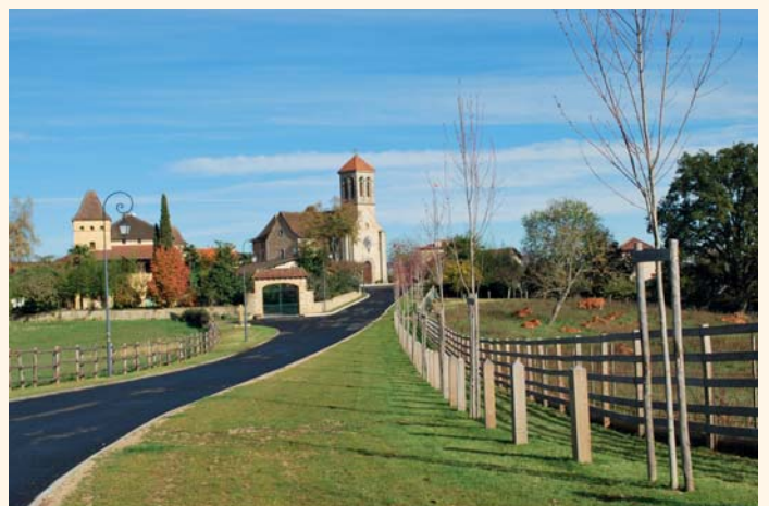
Un soin particulier a été porté à la liaison entre les deux pôles du village.