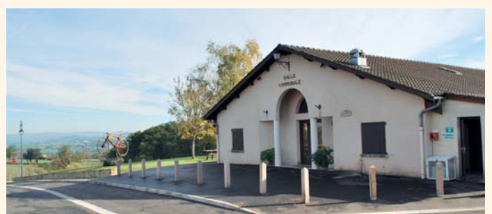
Le parvis de la salle polyvalente et les abords ont été redessinés.