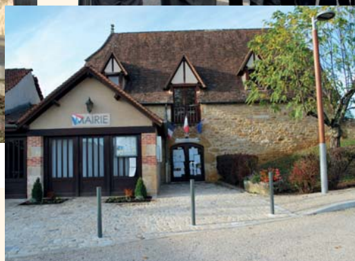
Un cheminement piétonnier accessible aux personnes à mobilité réduite, relie la Mairie à la salle de fêtes.

À ce jour, Figeac-Communauté a réalisé 22 opérations sur 18 Communes de son territoire : Bagnac-sur-Célé, Béduer, Cajarc, Cambes, Camboulit, Camburat, Faycelles, Felzins, Figeac, Fourmagnac, Lentillac-Saint-Blaise, Marcilhac-sur-Célé, Montredon, Planioles, Prendeignes, Saint-Jean Mirabel, Saint-Pierre Toirac, Saint-Félix.