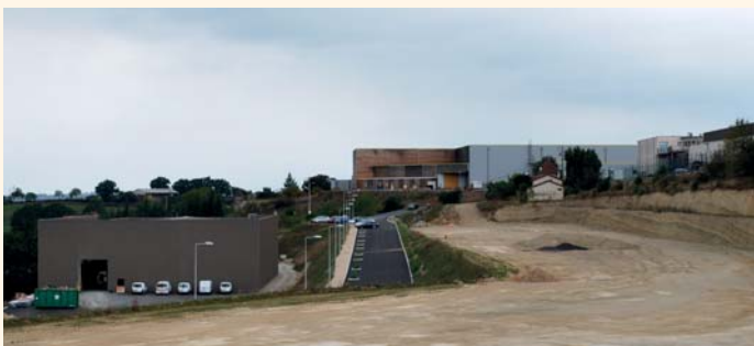
Sur les deux plateformes aménagées, l'entreprise Figeac-Aéro poursuit son développement.

Deux plateformes ont été aménagées, un bassin de rétention des eaux pluviales et un parc de