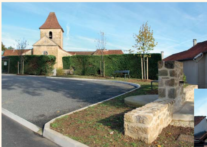
À côté de la fontaine, les plantations et le mobilier urbain apportent la touche finale au projet.