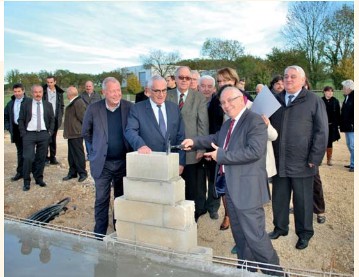
Pose de la première pierre.

Situés à l'entrée du parc d'activités de Quercypôle, les 800 m 2 de locaux se composeront de trois ateliers de 200 m 2 et d'un espace tertiaire de 200 m 2 (4 bureaux de 50 m 2 ). Tous les ateliers seront équipés d'une dalle pouvant supporter des machines lourdes, l'un d'eux possèdera même un pont roulant. Chaque entité fonctionnera de façon indépendante et sera modulable afin de répondre aux besoins des entreprises.