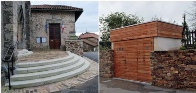
Un parvis commun pour l'église et la mairie. Les toilettes publiques et la cabine téléphonique, bien intégrées.