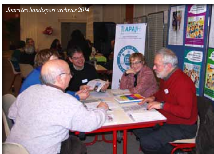
Journées handisport archives 2014