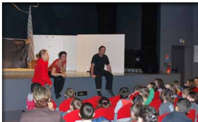
Echange avec les élèves de l'école maternelle