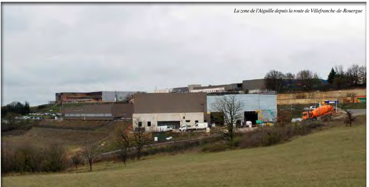
La zone de l'Aiguille depuis la route de Villefranche-de-Rouergue

En parallèle, sera lancée par le Conseil Général du Lot la consultation des entreprises pour la réalisation du giratoire d'entrée dans la zone depuis la route de Villefranche (RD 822). Une opération réalisée sous maîtrise d'ouvrage départementale. Le giratoire, qui améliorera nettement la sécurité des usagers et des riverains, devrait être opérationnel à la rentrée 2015.