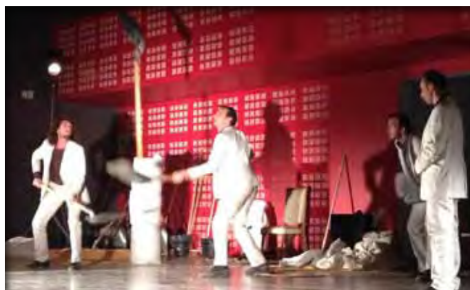
Le collectif G. Bistaki à Théminettes