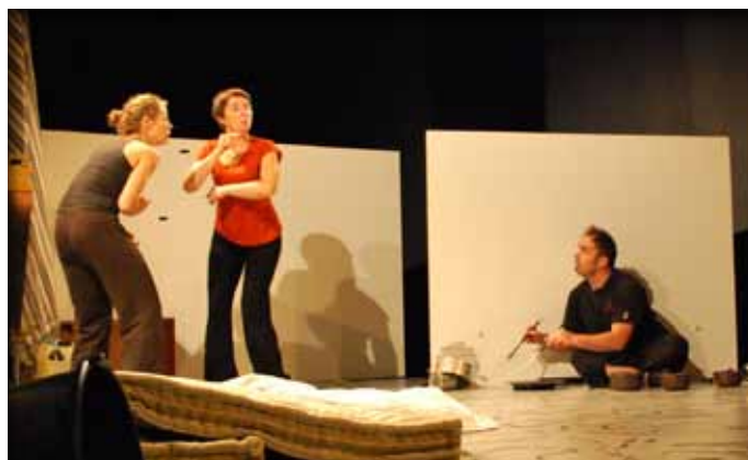
La Compagnie Les Pieds Bleus à Leyme

De nouvelles résidences sont en cours de programmation pour l'année 2015. A suivre.