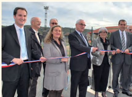
Z.A la Rotonde : inauguration de l'extension.