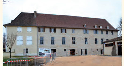
Lissac et Mouret : réhabilitation de l'ancien couvent.