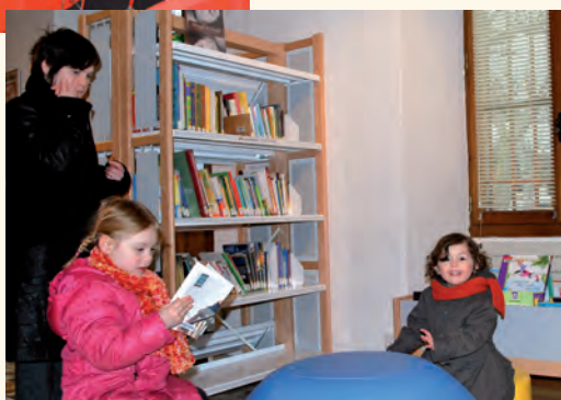
Cajarc : bibliothèque « Françoise Sagan ».