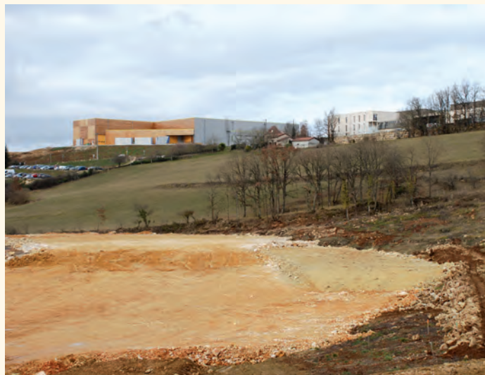
Le chantier début janvier.

En parallèle, mi-février ont démarré les travaux de la tranche 1. Après les terrassements suivront les travaux de viabilisation (réseaux, voirie, stationnement et cheminement piétonnier) et enfin les aménagements paysagers. Un soin particulier a été porté à l'intégration environnementale du projet : création d'une zone d'insertion paysagère, végétalisation des talus, plantations d'arbres sur les aires de stationnement et en bordure de voirie, constructions de murets en pierre. Le montant global de ces travaux s'élève à 1 436 000 € H.T.