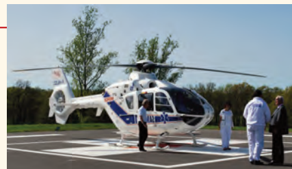
Quercypole : l'hélicoptère.