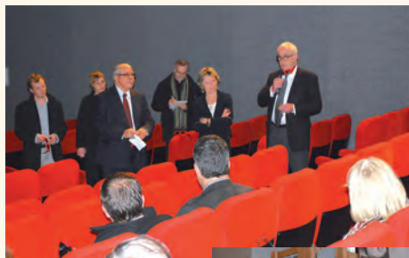
Équipement numérique des cinémas : inauguration.