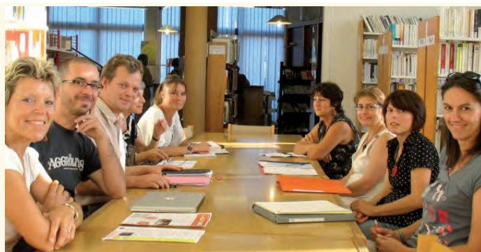
Les membres du collectif « A petit pas ».

Un programme d'actions, élaboré collectivement, était lancé fin 2011 : spectacles, courts et moyens métrages, films documentaires, lectures, mais aussi conférences, ateliers et formations à destination des professionnels et des parents. Il se poursuivra en 2012 avec notamment :