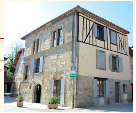
Fons : l'ancienne judicature royale réhabilitée.