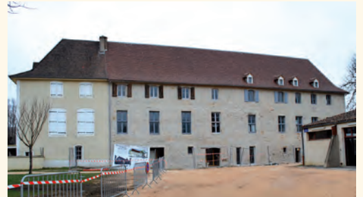
Lissac et Mouret : réhabilitation de l'ancien couvent.