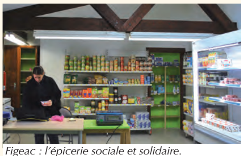
Figeac : l'épicerie sociale et solidaire.

■ La fin de l'année 2011 fut marquée par l'ouverture de l'Épicerie Sociale et Solidaire, place Vival à Figeac. Un « coup de pouce » aux plus démunis doublé d'un accompagnement social pour les guider vers la réinsertion et l'autonomie.