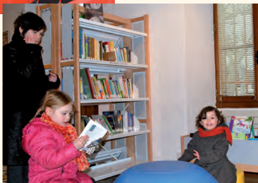
Cajarc : bibliothèque « Françoise Sagan ».