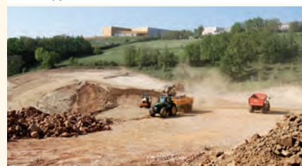
Z.A de l'Aiguille : travaux d'extension.