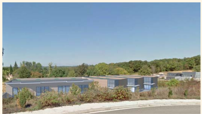
Intégration paysagère dans le site.