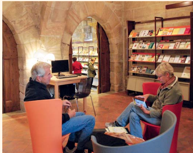
Nouvel espace avec borne multimédia et connexion internet gratuite.

Aujourd'hui, le rez-de-chaussée est dédié à l'accueil du public. Autour de la banque d'accueil installée au centre de la salle sud, les visiteurs ont à leur disposition plusieurs espaces pour découvrir les nombreux atouts du territoire : documentation,