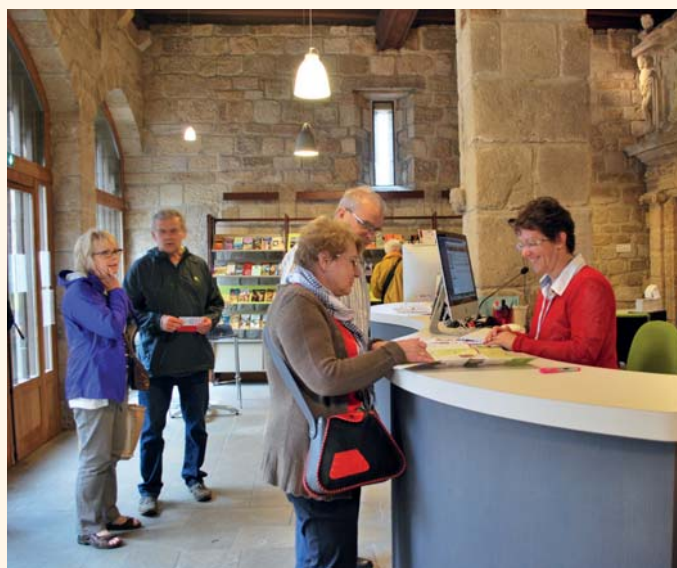
La nouvelle banque d'accueil au rez-de-chaussée.

boutique, borne internet et mur d'images dédié aux Grands Sites de Midi-Pyrénées. Un espace détente, avec un coin pour les enfants, invite petits et grands à faire une pause.