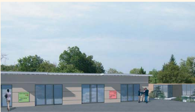
Façade d'un des bâtiments.

Les lots de travaux ont été attribués aux entreprises mi-juin ; les travaux vont donc pouvoir commencer dans les prochaines semaines. Après dix mois de chantier, l'hôtel d'entreprises devrait être opérationnel avant l'été 2014.