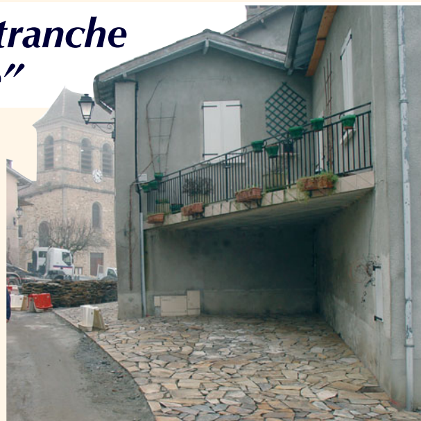
Création d'un cheminement piétonnier et réfection de la chaussée pour les rues situées aux abords de l'église.