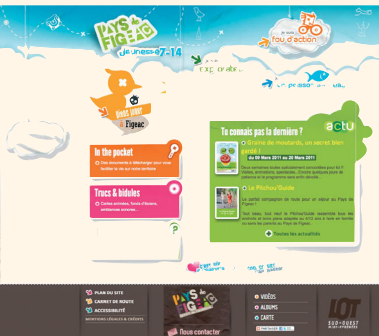
Ludique et interactif, le mini-site enfant s'adresse aux 7-14 ans

Sont en préparation un reportage sur les pèlerins du chemin de Saint-Jacques et un autre sur la production de fromages de brebis.