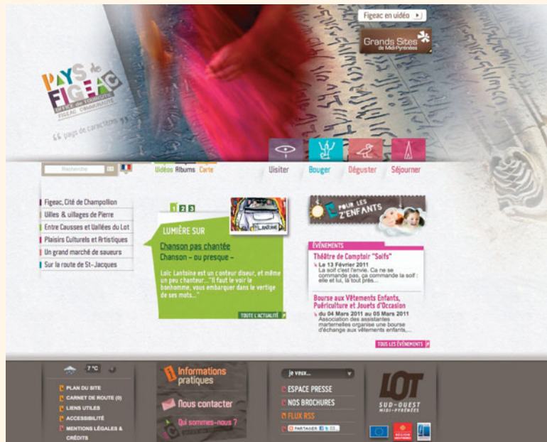
Graphisme élégant, bandeaux dynamiques, photos... dès la page d'accueil le visiteur doit être séduit.