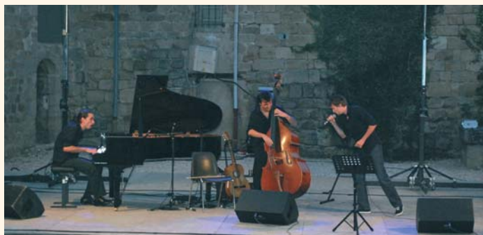
Le Groupe "Pauvre Martin" a montré tout son talent créatif.

Cinétoiles, c'était 18 séances, 18 rendez-vous privilégiés pour découvrir ou redécouvrir le 7 ème art, des moments de convivialité à travers des manifestations d'échappées culturelles. L'art de la scène faisait également parti des programmes de nos soirées d'été. Une fois par semaine, les Terrasses du Puy se sont transformées au coucher de soleil en scènes musicales.