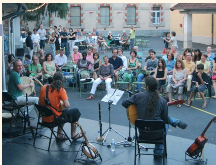
Mise en bouche musicale par le groupe Irish Frogs.

En effet, après avoir offert au public un spectacle entre compositions personnelles et reprises des plus grands musiciens, ce même trio a magnifiquement