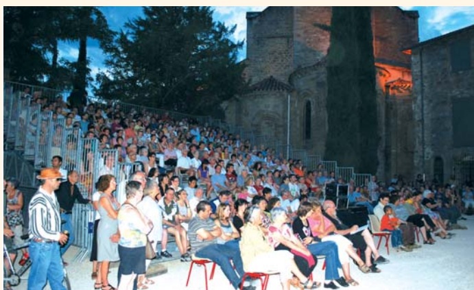
Les Mardis de l'été ont rassemblé un large public, environ 400 personnes étaient présentes à chaque spectacle.

Cet été, de nombreux touristes et habitants des villages alentours ont pu profiter des projections en plein air au cœur des villages et des rendez-vous musicaux aux Terrasses du Puy à Figeac.