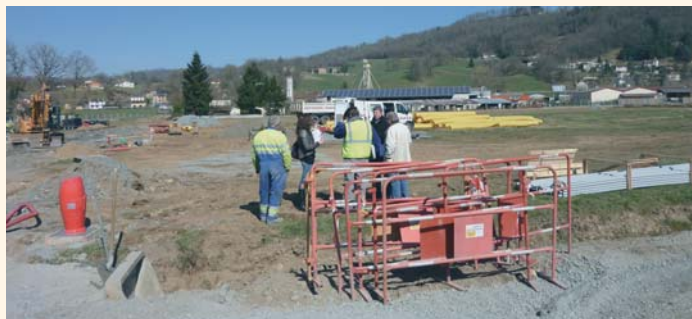
Réunion de chantier courant mars.

Rappelons que le projet d'extension de la zone d'activités de Larive porte sur une superficie globale de 3,6 ha et permettra d'offrir 3 ha à la commercialisation. Une opération estimée à 452 017 € H.T. pour laquelle Figeac-Communauté a sollicité la participation financière de l'Etat, de la Région et du Département.