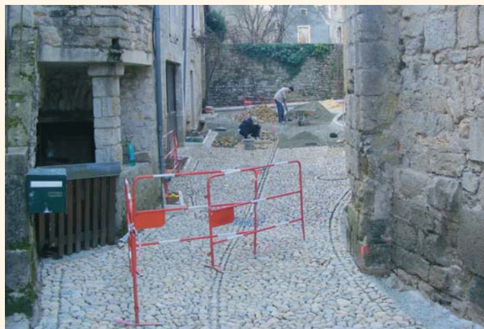
Les abords de l'abbatiale et les ruelles en cours de traitement.

Le projet concerne deux secteurs : l'enceinte de l'abbaye (mise en valeur et en sécurité de l'abbaye et de ses abords par la réfection du revêtement de sol en dallage et galets, la création d'espaces fleuris...) et la place du Pampolet (requalification de cette entrée du village en sécurisant les circulations et l'aire de stationnement, création de trottoirs...). Les travaux doivent s'achever à la fin du mois de mai. Dès le début de la saison touristique, les visiteurs découvriront les ruelles réaménagées et profiteront des promenades sur les berges du Célé.