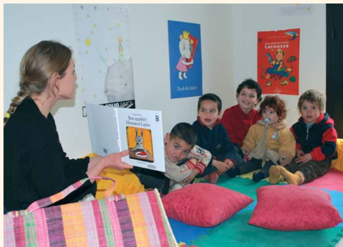
Atelier de sensibilisation à la lecture avec les enfants de l'aire des gens du voyage

■ le RAM "L'Ilot Câlin", avec la participation du Jardin d'Enfants de la Ville de Figeac, a proposé aux petits de moins de 4 ans et à leurs parents un spectacle de marionnettes et de contes , suivi d'un débat autour du