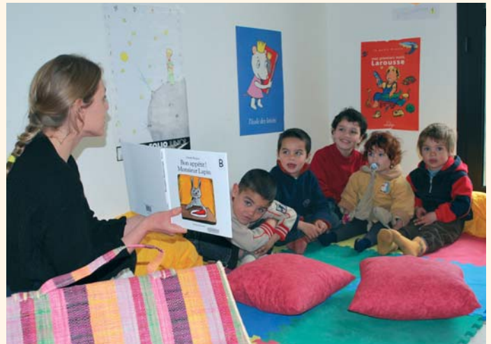
Atelier de sensibilisation à la lecture avec les enfants de l'aire des gens du voyage

■ le RAM "L'Ilot Câlin", avec la participation du Jardin d'Enfants de la Ville de Figeac, a proposé aux petits de moins de 4 ans et à leurs parents un spectacle de marionnettes et de contes , suivi d'un débat autour du