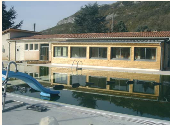
Les locaux réaménagés côté bassin.

Une opération d'un montant global de 332 226 € H.T. -dont 290 903 € H.T. de travaux- pour laquelle Figeac-Communauté a reçu le soutien financier de l'Etat (63 754 €), de la Région (61 920 €) et du Département