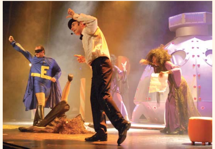
Décor, costumes, lumières, chansons... tous les ingrédients étaient réunis !

Bravo à la commission Animation de l'O.I.S. et au service Petite Enfance du C.I.A.S. qui, pendant plusieurs mois, se sont mobilisés pour organiser cet événement !