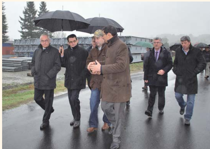
Visite de la zone d'activités par les officiels. En fond, les installations de l'entreprise Matière.

En six mois, 3,6 ha, dont 3 ha commercialisables, ont