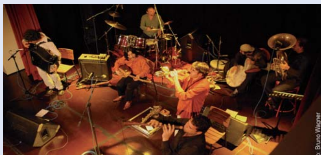
Bazar Kumpanya

> Le site www.culture-figeac-communaute.fr : présentation détaillée des rendez-vous spectacle, cinéma et lecture publique ; billetterie spectacle et catalogue des bibliothèques en ligne.