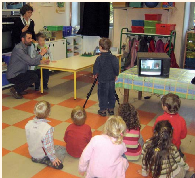
Atelier vidéo avec les enfants de la maternelle du RPI Fons-Cardaillac.

Les cinémas de Figeac-Communauté poursuivent également un travail en direction du jeune public . Au delà de la participation aux dispositifs Ecoles et cinéma , Collège au cinéma , Lycéens et jeunes au cinéma , ils proposent aux établissements des films accompagnés de documents pédagogiques ( Ciné Junior ), des films en