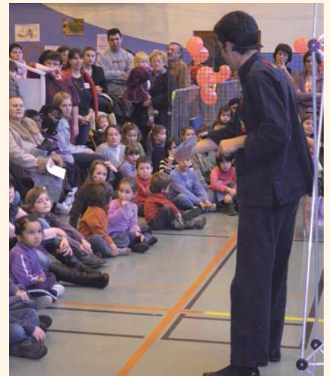
...et spectacle de magie.

Nouvelle réussite pour le Forum Petite Enfance, organisé pour la troisième année par les associations d'assistantes maternelles de Figeac ("L'enfant et nous"), Capdenac-Gare ("Les Pitchous Nounous") et Decazeville ("Allo Nounou") avec l'appui des trois Relais Assistantes Maternelles : l'Ilôt Calin, La Farand'Olt et la Capirole. Il avait lieu cette année les 18 et 20 novembre à Capdenac-Gare.