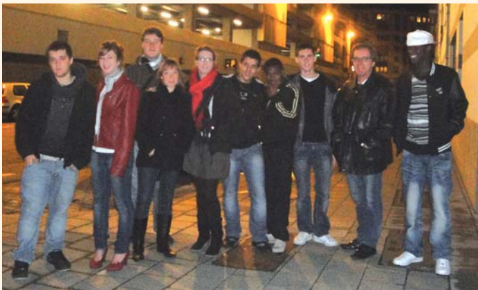
Les jeunes cajarcois à Bruxelles, encadrés par leurs deux animateurs.

Dans le cadre d'un "projet européen d'échanges jeunes", huit jeunes de Cajarc ont passé une semaine à Bruxelles pendant les vacances de Toussaint. Un voyage organisé par l'Espace Jeunes intercommunal de Cajarc suite à un premier échange proposé cet été, dans le cadre du festival Africajarc.