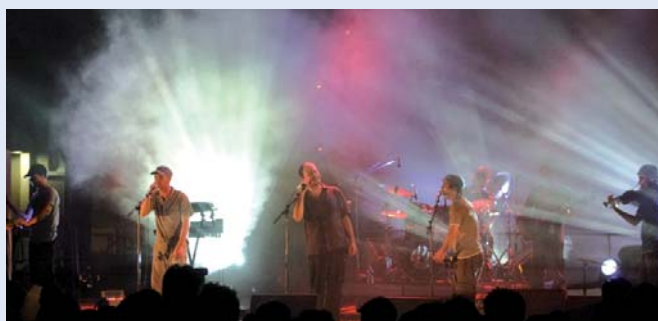
Le Comité