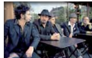
La Danse du Chien