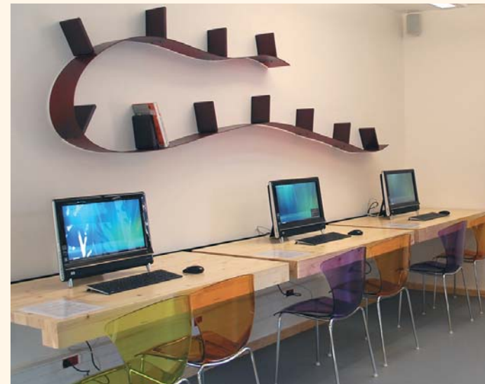
Un bel espace dédié au multimédia

La présence du bois, le mobilier très coloré, le patio au centre du bâtiment qui laisse entrer la lumière naturelle... tout donne à cet espace un caractère très convivial.