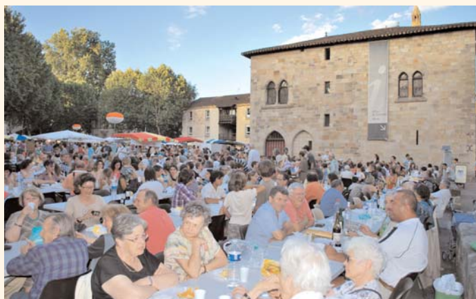
Les marchés nocturnes : l'occasion de déguster les produits régionaux.

Heureusement, la météo très favorable en juillet et août a assuré le succès de toutes les animations programmées en extérieur. Les marchés nocturnes ont très bien fonctionné, les visites guidées de Figeac ont rassemblé près de 1 400 personnes (contre 1 151 en 2008) avec un succès particulier pour les nocturnes et les nouvelles thématiques.