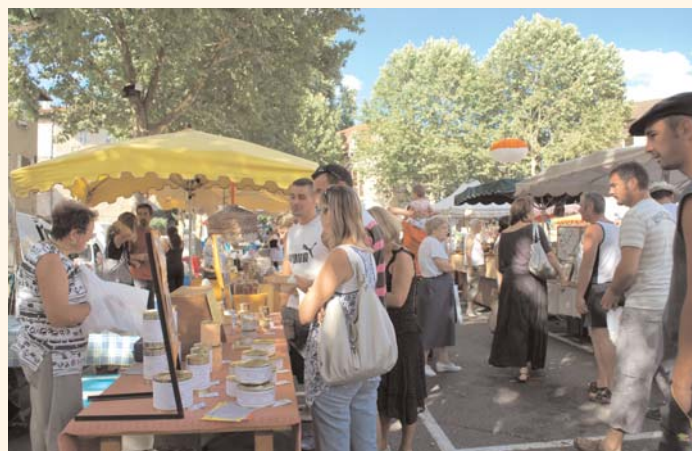
A la rencontre des producteurs locaux et des artisans d'art.

(* ) Bagnac-sur-Célé, Cajarc, Capdenac-Gare, Capdenac-le-Haut, Faycelles, Figeac et Marcilhac-sur-Célé.