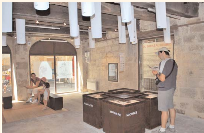
L'exposition " Du simple au double : l'écriture multipliée ".

Satisfaction également pour les équipes du service du Patrimoine et du Musée Champollion - les Ecritures du Monde. Leurs expositions respectives ont attiré de nombreux visiteurs durant les deux mois d'été : 3 933 personnes pour l'Espace Patrimoine et l'exposition "Les témoins invisibles-monuments disparus de Figeac" et 4 500 personnes