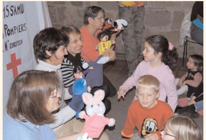
Spectacle de marionnettes des assistantes maternelles en partenariat avec la Farand'Olt, RAM de Capdenac-Gare (archives 2008).

Actuellement, les animatrices travaillent aux différents projets de fin d'année en partenariat avec les assistantes maternelles du secteur : le montage d'un spectacle de marionnettes, l'organisation de deux soirées thématiques avec le Contrat Enfance (l'une sur le sommeil, l'autre sur l'enfant face au divorce de ses parents), la participation à un Forum (voir encadré) et à une formation avec le GRETA.