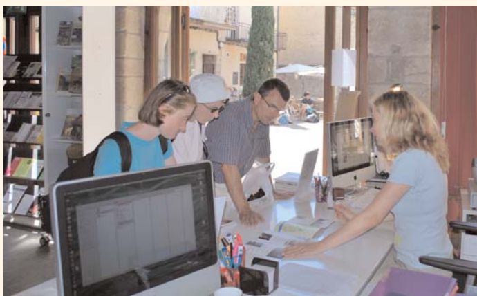
L'Office de Tourisme, une mine de renseignements pour les visiteurs

Autre tendance, la présence continue des pèlerins de Saint-Jacques de Compostelle durant l'été. Habituellement, on ne les croise que d'avril à juin puis en septembre.