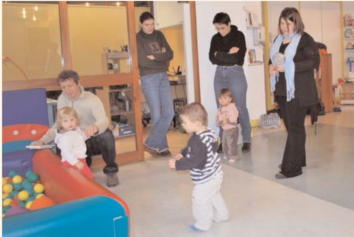
L'Ilot Câlin, le RAM de Figeac

"L'Ilot Câlin" est un lieu d'accueil et d'information au service des assistantes maternelles et des parents.