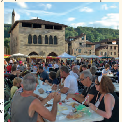
Les marchés nocturnes : une bonne occasion pour découvrir les spécialités régionales.

Les visites guidées, qui jouissent d'une bonne renommée, sont également en progression alors que celles proposées sur les villages alentours enregistrent une légère baisse.