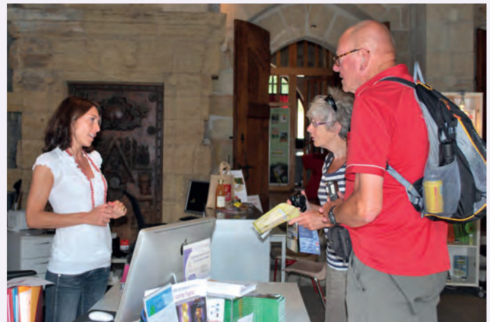
Le complet réagencement des locaux va permettre au personnel d'accueillir les visiteurs dans de meilleures conditions.

Les jours et horaires d'ouverture sont inchangés. Le personnel chargé de la partie administrative a été relogé dans les locaux de l'Espace Jeunes de Figeac.