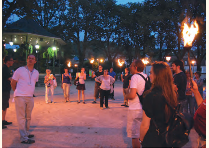
Visite guidée de Figeac à la lueur des flambeaux.

Les visiteurs sont présents mais restent très vigilants sur leurs dépenses. « Nous le constatons à l'accueil