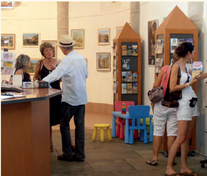
Le bureau de Cajarc, très fréquenté cet été.

Sur le bureau de Figeac, la fréquentation du mois de juin est en baisse, juillet et septembre restent stables mais le mois d'août a été excellent avec une hausse de 6 %. Le bureau de Cajarc a fait une très bonne saison, liée à l'attractivité d'Africajarc et, cette année plus particulièrement, de Saint-Cirq Lapopie récemment désigné « village préféré des Français ».