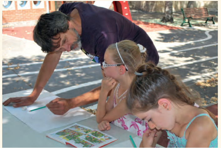
Chaque été, grâce aux « Mardis Curieux » les enfants s'initient à différentes activités. Ici, la Bande Dessinée.

Les ventes à la boutique sont en hausse, notamment grâce à la médaille de la Monnaie de Paris. Depuis sa mise en vente le 10 juillet, plus de 2 000 pièces ont été achetées par des collectionneurs figeacois mais aussi par les visiteurs qui aiment bien ramener un petit souvenir de leur séjour.