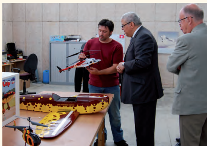
Au mois de mai, le Sous-Préfet de Figeac visitait le parc d'activités Quercypôle et la pépinière. Ici, dans les locaux de la société AMFR.