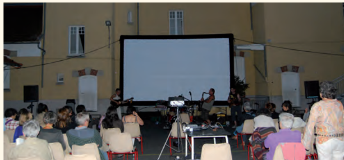
Mise en bouche musicale avant la projection

Côté programmation, les organisateurs avaient fait le choix de propositions très différentes (film muet, western, courts-métrages, documentaire) et ne le regrettent pas car cela a permis de capter un public plus varié que l'an passé. Soirée particulière, celle organisée en partenariat avec l'association Gindou Cinéma autour de trois courts métrages tournés dans la région, qui a permis de donner une couleur territoriale à l'événement. L'occasion également d'illustrer la volonté des services culturels de Figeac-Communauté