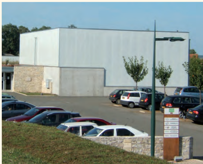
La pépinière, un excellent tremplin pour la toute jeune entreprise Whylot.

clients et des partenaires potentiels. »