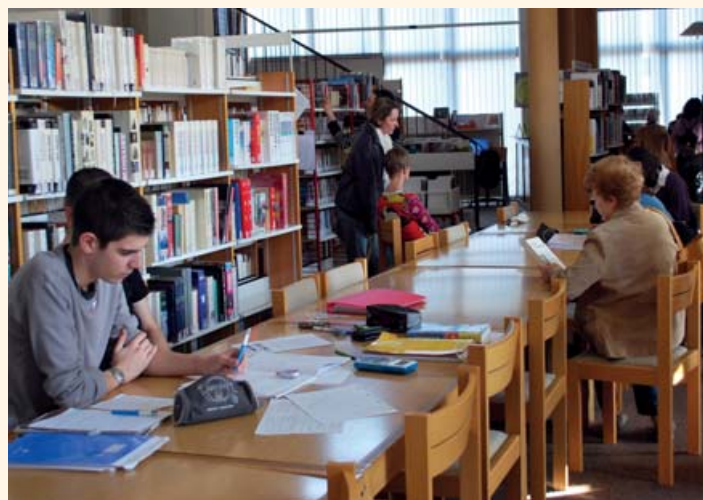
L'actuelle bibliothèque est en passe de devenir une médiathèque moderne répondant aux attentes des usagers en matière de lecture et de multimédia.

Sur 1 600 m 2 (contre 616 m 2 dédiés à l'actuelle bibliothèque), le projet s'articule autour de plusieurs espaces : un hall, des espaces de travail médiathèque, un espace public numérique, un espace de parcours littéraire, un espace dédié au fonds ancien, un autre dédié au conte, une salle d'activités et des bureaux mutualisés entre les différents services.