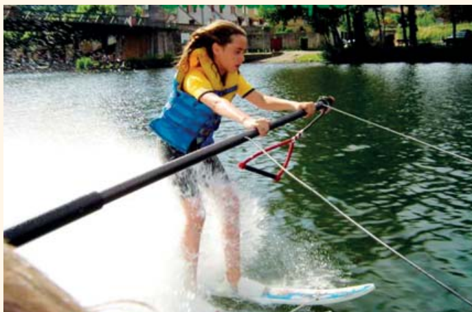
Parmi les disciplines proposées par l'école multisports : le ski nautique.

(*) Du CP au CM2 et uniquement du CE2 au CM2 pour les écoles de Capdenac-Gare, Cajarc, Marcihac-sur-Célé et Gréalou.