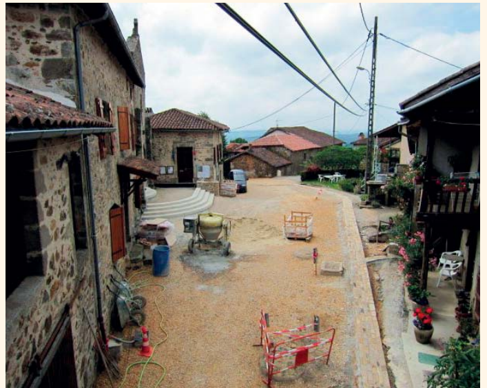
Le chantier début juillet.