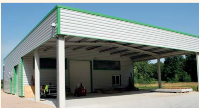
La société AT2D partage son atelier avec Lot Insertions Services. Une mutualisation de l'espace que les 2 entreprises pratiquaient déjà au sein de la pépinière Calfactech.

Un investissement au départ, mais, à moyen terme, des économies non négligeables réalisées sur le budget de fonctionnement de l'entreprise.