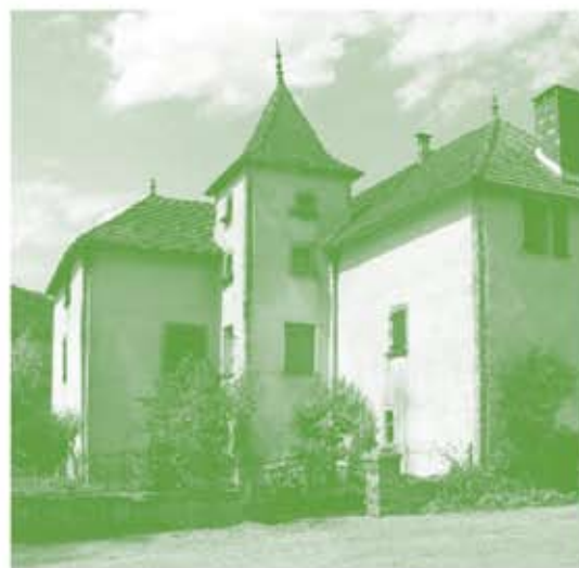
Enduit soulignant les chaînes d'angle et les encadrements

rejointoyer une façade est délicat. Même si les pierres restent apparentes, un joint trop clair ou trop foncé peut radicalement changer la couleur globale du mur. Or, un mur en pierre apparente doit être de la couleur de la pierre. Il est important de choisir un joint d'une couleur s'alliant dans sa teinte et son ton à celle de la pierre.