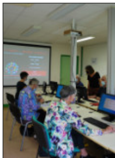
en Une : Atelier à la Cyberbase du Grand-Figeac

Une publication éditée par le Grand-Figeac