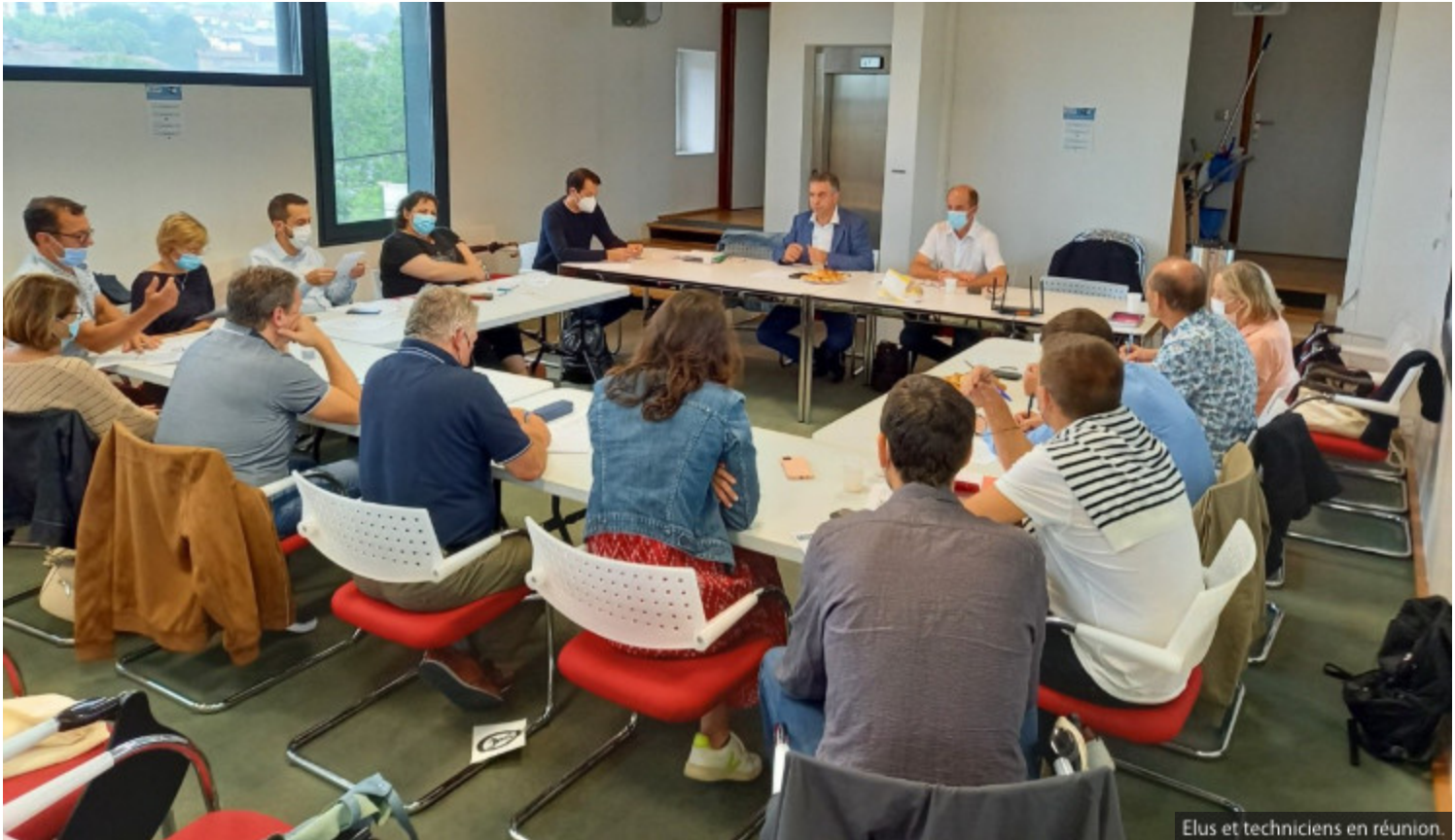
Elus et techniciens en réunion.

Voyage d'étude et de sensibilisation autour des projets de cœurs de villages