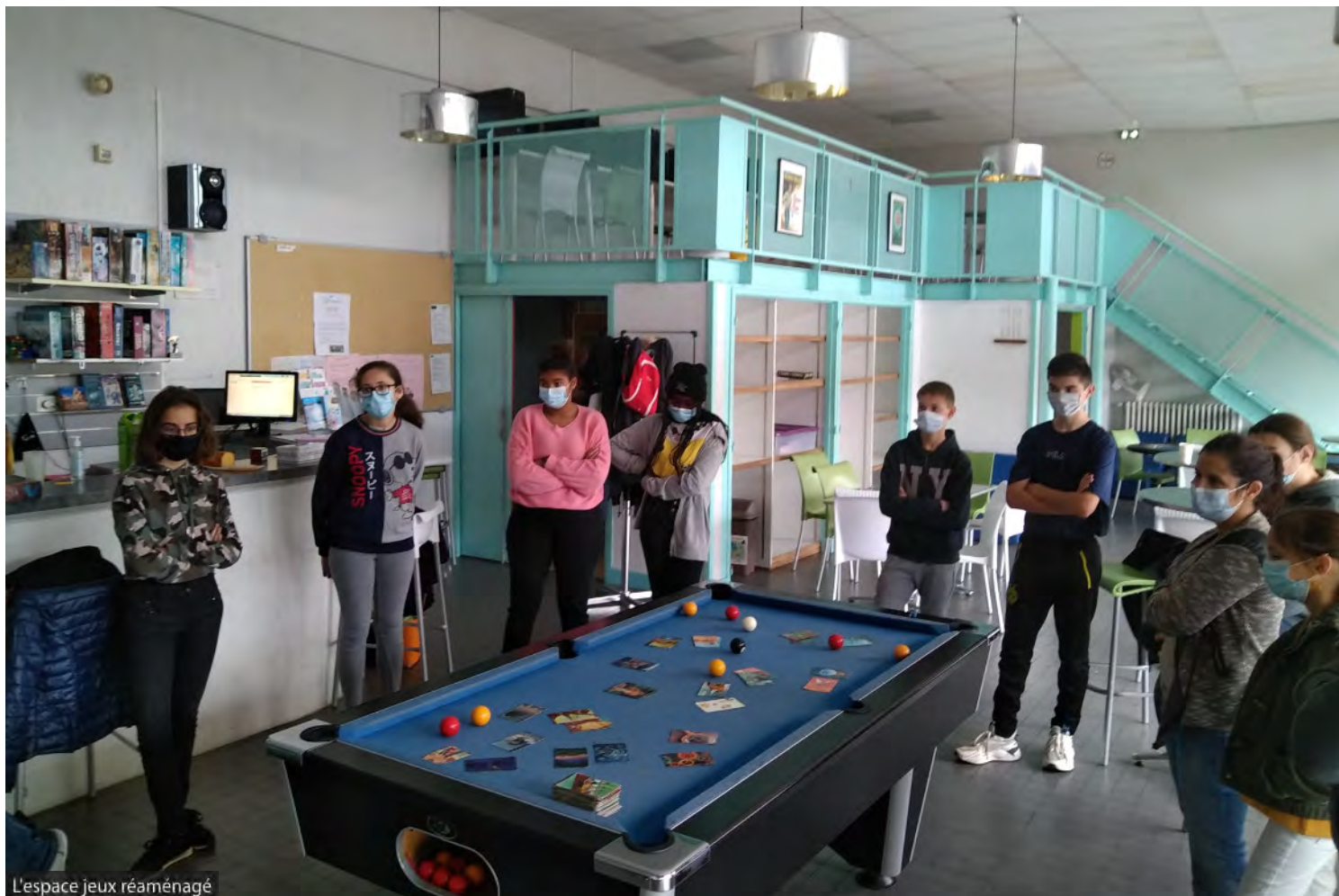
L'espace jeux réaménagé

Depuis bientôt 20 ans, l'Espace Jeunes du Grand-Figeac répond à trois objectifs : accueillir les jeunes de 14 à 25 ans et créer du lien social avec et entre eux, les accompagner dans leur vie quotidienne comme dans leurs projets collectifs, porter des messages de prévention.