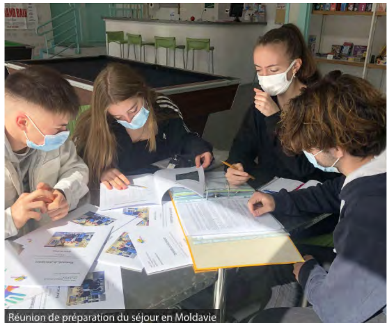
Réunion de préparation du séjour en Moldavie

Là-bas nous participerons à la rénovation de locaux destinés à une fromagerie et nous nous transformerons en animatrices et animateurs tous les après-midis auprès des enfants des villages avoisinants. Mais avant le départ, vous pourrez nous retrouver sur les marchés où nous vendons des gâteaux pour financer notre voyage. Nous prévoyons également d'autres actions telle une collecte de matériel scolaire et de vêtements donc soyez attentifs à nos affiches et articles de presse.