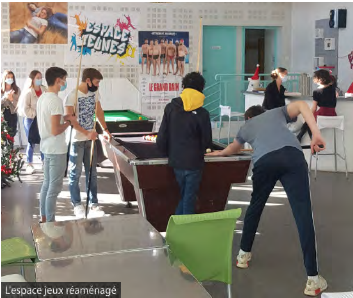
L'espace jeux réaménagé