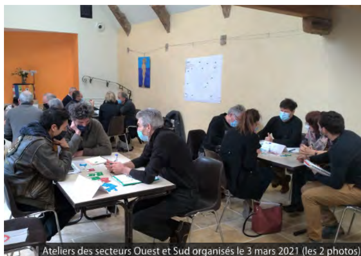
Ateliers des secteurs Ouest et Sud organisés le 3 mars 2021 (les 2 photos)