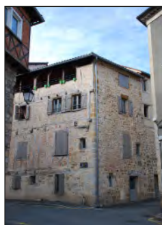
en Une : immeuble rénové rue Plancat - Figeac

Une publication éditée par le Grand-Figeac