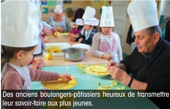
Des anciens boulangers-pâtisseries heureux de transmettre leur savoir-faire aux plus jeunes.