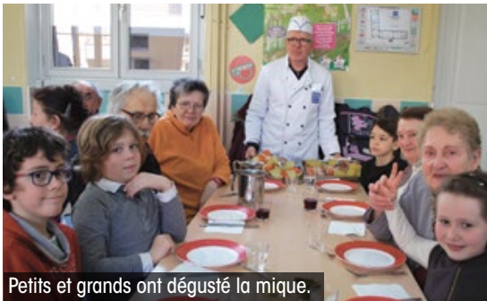
Petits et grands ont dégusté la mique.