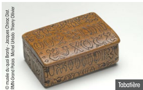
© musée du quai Branly - Jacques Chirac Dist. RMN-Grand Palais Michel Utraco Thierry Olivier