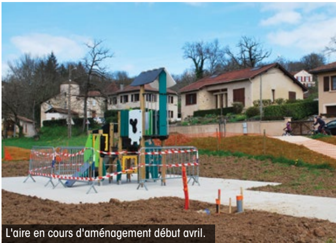
L'aire en cours d'aménagement début avril.

Au carrefour de l'avenue des Carmes et du chemin de la Curie, en prolongement du parking réalisé en 2017, la Ville vient d'aménager une nouvelle aire de loisirs.