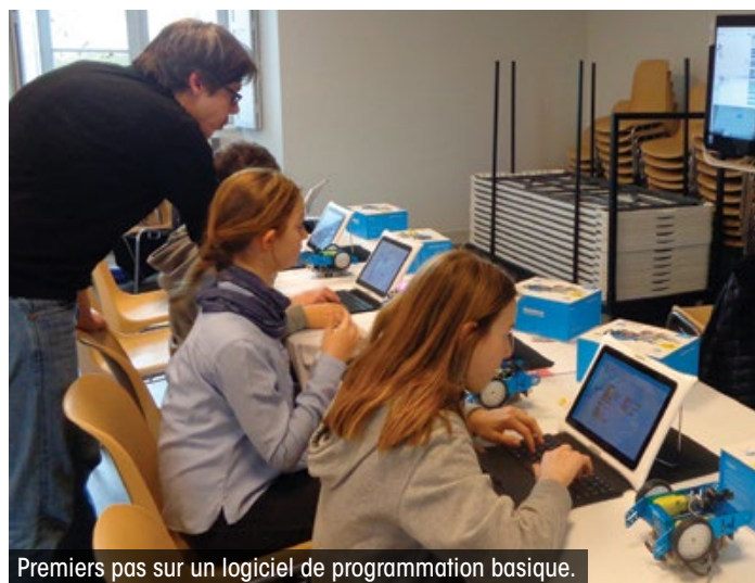
Premiers pas sur un logiciel de programmation basique.

(*). D'après une étude, 25% de la population lotoise serait touchée par « l'illettrisme numérique ».