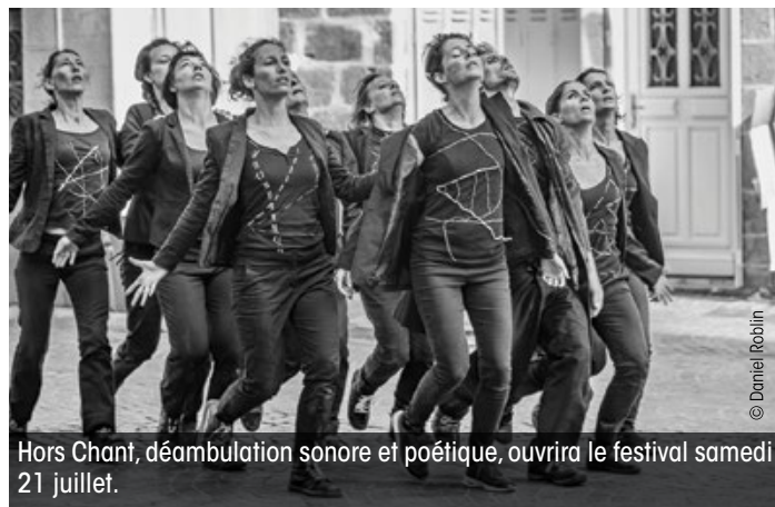
Hors Chant, déambulation sonore et poétique, ouvrira le festival samedi 21 juillet.