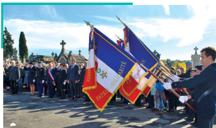
Au cimetière de Figeac, comme à Ceint d'Eau, hommage et recueillement pour les quelques 200 Figeacois tombés au combat.