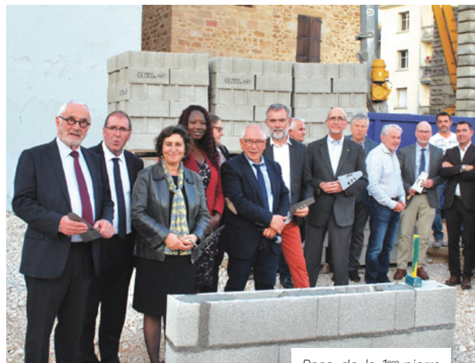
Pose de la 1 ère pierre le 19 octobre dernier