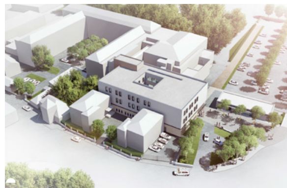
Une fois les locaux de l'OIS démolis, le nouveau bâtiment et l'accès par le giratoire des Carmes modifieront totalement l'image du quartier, offrant une meilleure visibilité à l'hôpital.

Un projet de 8 M€ financés par l'Agence Régionale de Santé Occitanie à hauteur de 5,1 M€