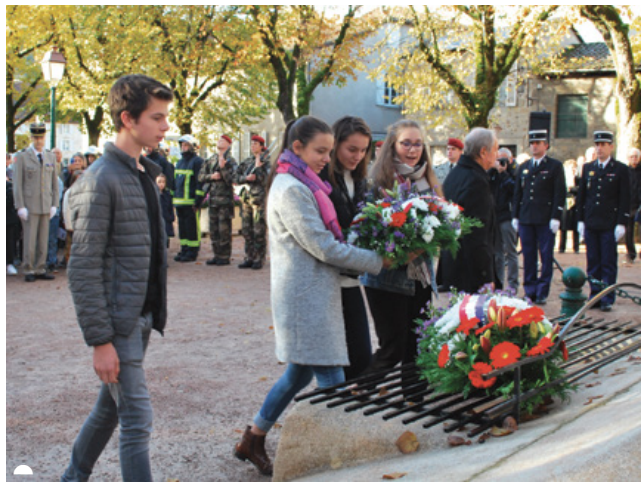
Place de la Raison comme au cimetière, le dépôt des gerbes des anciens combattants de Figeac a été confié à la jeune génération.

Les manifestations du Centenaire, élaborées durant plusieurs mois au sein d'un comité de pilotage, ont tenu toutes leurs promesses en offrant au public des animations de grande qualité . La Ville a d'ailleurs reçu le label national pour l'ensemble du programme.