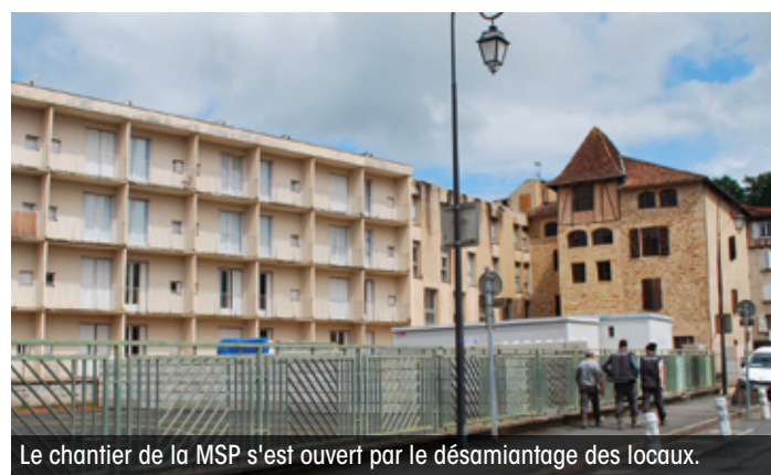
Le chantier de la MSP s'est ouvert par le désamiantage des locaux.