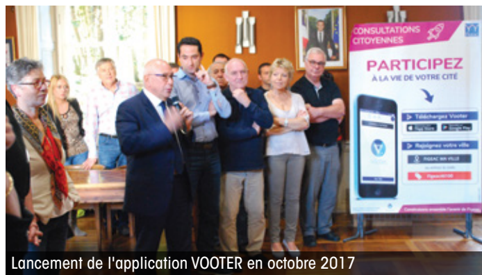
Lancement de l'application VOOTER en octobre 2017

■ outils numériques : comprendre , dès le plus jeune âge, le « bon usage » du numérique et en identifier les risques à travers les outils du quotidien (smartphones, tablettes, réseaux sociaux...), était l'objectif de la municipalité en accueillant le MAIF Numérique Tour . Durant 3 jours, des animations gratuites ont permis au public de manipuler et de se familiariser avec des technologies comme la réalité virtuelle, les objets connectés ou l'intelligence artificielle.