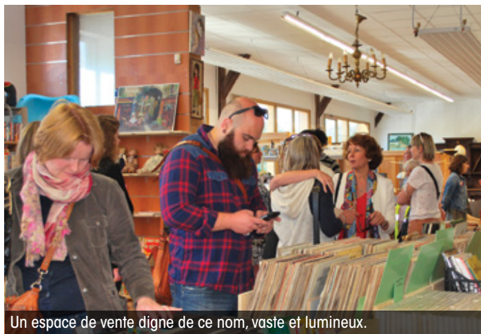
Un espace de vente digne de ce nom, vaste et lumineux.