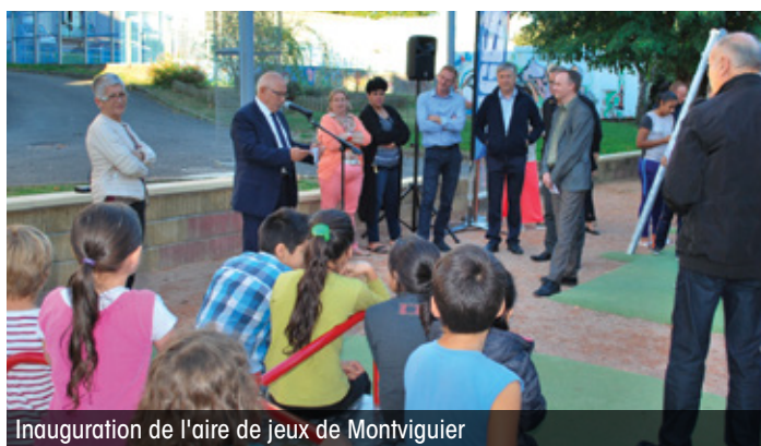
Inauguration de l'aire de jeux de Montviguier

pour sportifs, tables de pique-nique, fontaine et sanitaires à la Curie, en prolongement du parking . Un plus pour les familles riveraines et les promeneurs qui empruntent le GR6 dont le départ se situe à proximité.