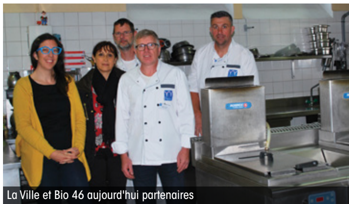
La Ville et Bio 46 aujourd'hui partenaires