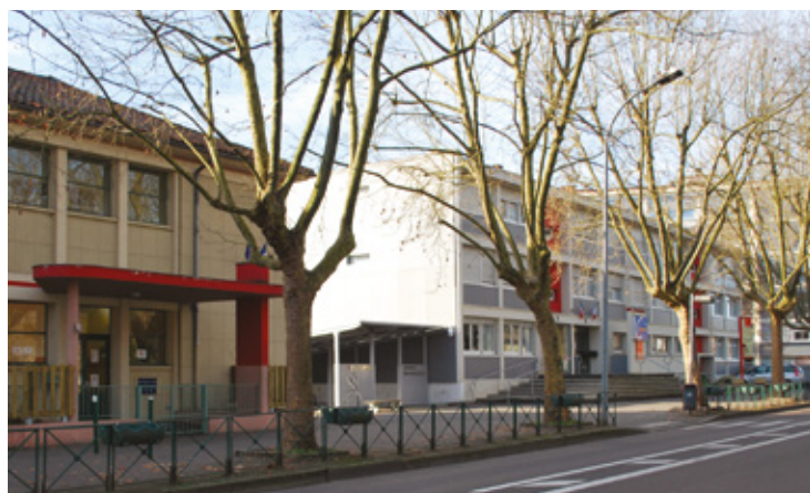
▲ Parmi les secteurs prioritaires, les abords des établissements scolaires.

Le projet est entré dans sa phase concrète avec l'installation mi-décembre des premières caméras par l'entreprise Eiffage. Le déploiement s'échelonne jusqu'à fin février pour une mise en service en mars 2020.