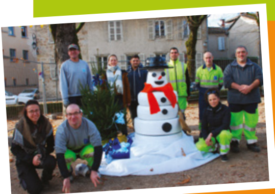
Pneus, seaux, couvercles, tuyaux ont servi de base à ce décor original !