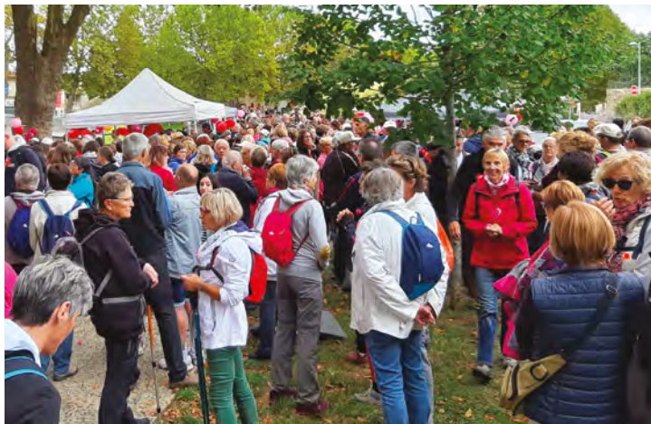
▲ Samedi 5 octobre, plus de 500 personnes ont répondu à l'appel de l'ADAR.

Grâce à la générosité de tous, l'opération a permis de récolter 4 287 €. Cette somme sera entièrement reversée au comité local de la Ligue contre le cancer qui, tout au long de l'année, accueille et informe le public, soutient et accompagne les malades et leur entourage.