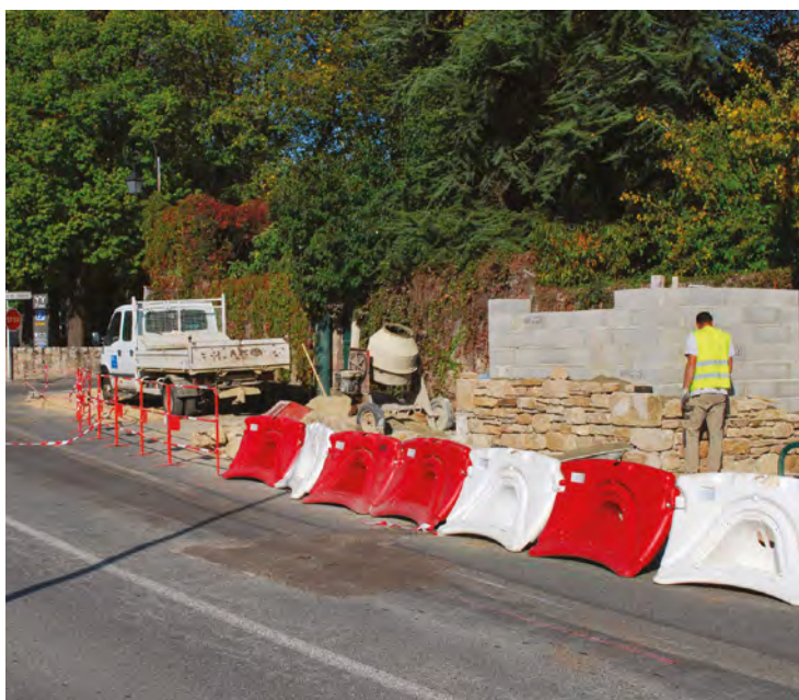
Mi-octobre, construction du bâtiment qui abritera le nouveau bloc sanitaire.

(*) Dotation d'Équipement des Territoires Ruraux