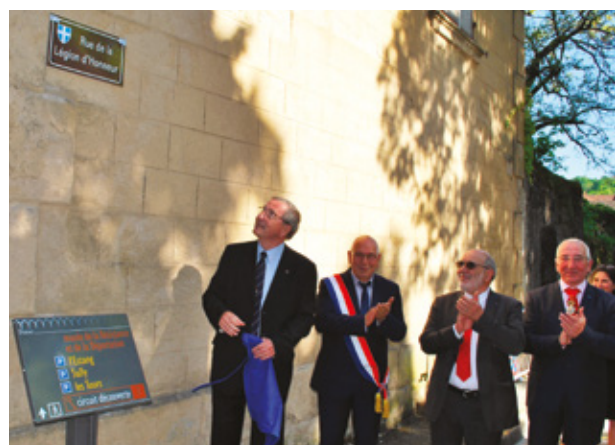
▲ La plaque a été dévoilée par l'Amiral Alain Coldefy, président national de la SMLH.