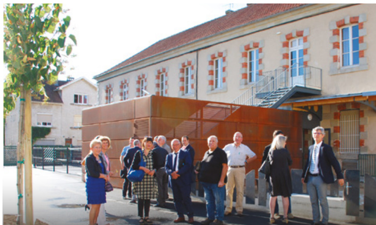
A Paul Bert, les élèves pourront pratiquer le sport dans une cour entièrement réaménagée suite à la création de la Maison de Santé.

Depuis la page d'accueil du site de la Ville, il permet aux familles de créer un compte, accessible 24h/24h et 7j/7j, et de régler en ligne les factures correspondantes aux repas pris à la cantine par leur(s) enfant(s). On peut aussi y consulter le menu mensuel de la cantine.