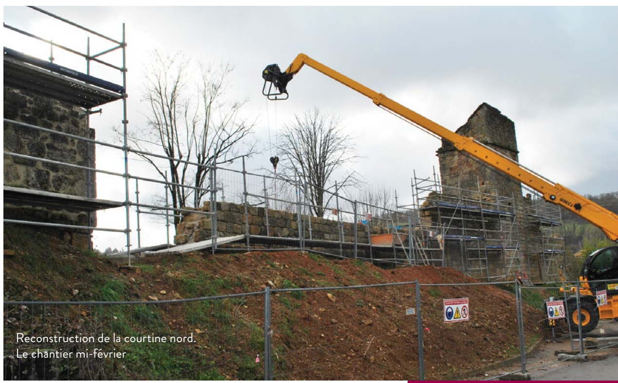
Reconstruction de la courtine nord. Le chantier mi-février

Situés Champ Saint-Barthélemy et longs de 350 mètres, les remparts sont les derniers vestiges de l'enceinte de la cité médiévale. Tracés au XII ème siècle, ces fortifications ont été régulièrement remaniées jusqu'au XVII ème siècle. Classés Monument Historique depuis 1995, les remparts ont bénéficié de campagnes régulières d'entretien. Depuis juin 2018, des travaux conséquents de sauvegarde et de réhabilitation sont menés sur la partie la plus dégradée, une section de 70 m de long intégrant une tour et deux courtines, l'une d'elle ayant été affectée par un éboulement en 2013.