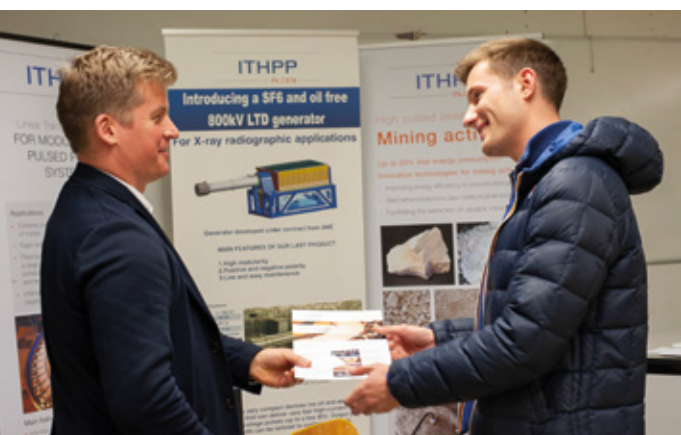
Quatre heures pour se rencontrer, échanger et candidater pour un stage.

Une première plébiscitée par tous (89 % de taux de satisfaction lors de l'enquête menée le jour J) et un événement qui sera reconduit en 2020.