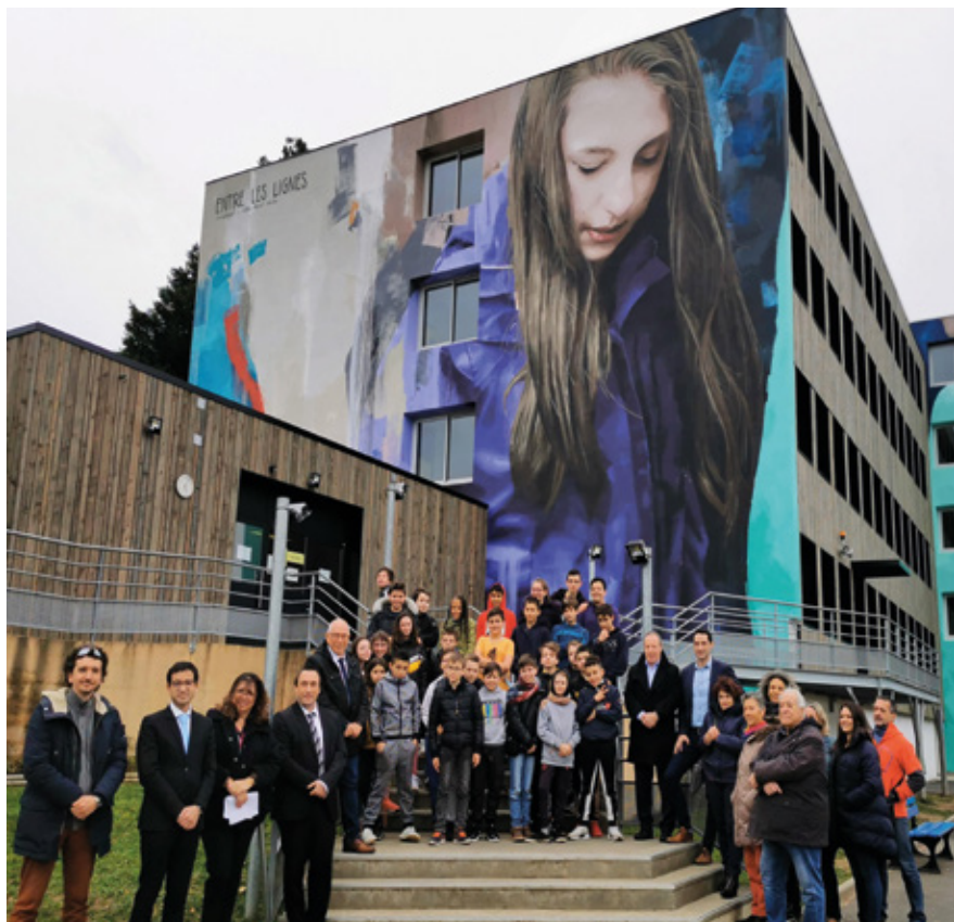
Inauguration de la fresque en présence de l'ensemble des acteurs du projet.

(*) Section d'Enseignement Général et Professionnel Adapté