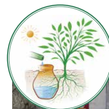
Les premiers ollas installés lors de la réfection des parterres à l'entrée de Londieu.

Son développement « agressif » à l'automne et au printemps étouffe les bonnes graminées. Pour maîtriser cette espèce et rééquilibrer l'état général de la pelouse, des interventions de scarification s'effectueront lorsque le pâturin sera en souffrance.