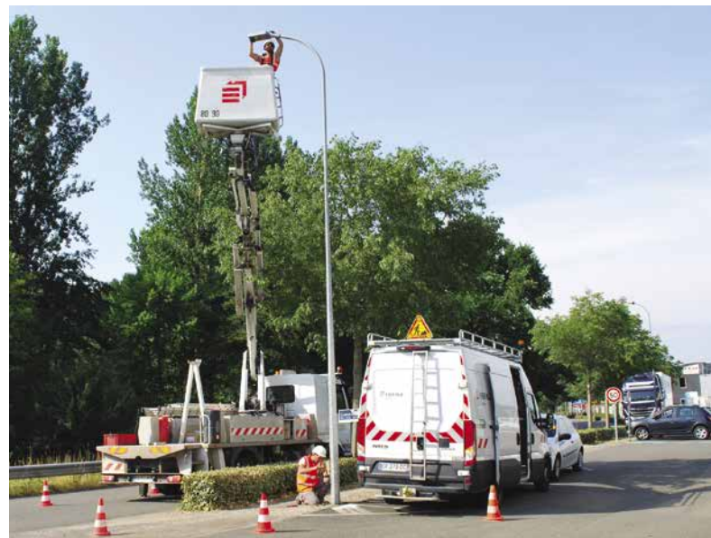
Mise en place des luminaires LED à la zone de Lafarrayrie en juillet 2019.

Une fois que tout le parc aura été rénové, les abonnements des Communes seront revus à la baisse pour être ajustés à leur consommation.