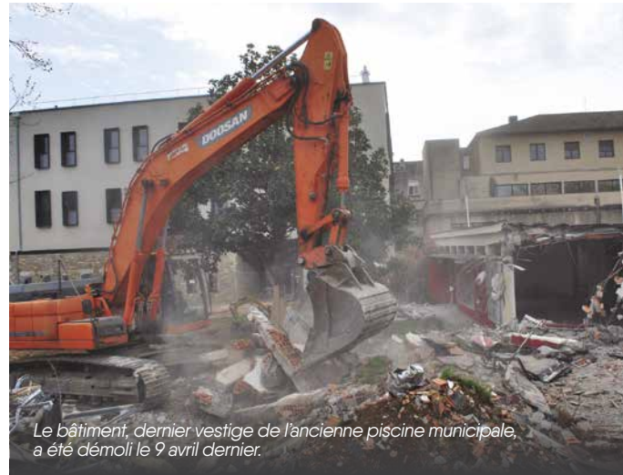
Le bâtiment, dernier vestige de l'ancienne piscine municipale, a été démoli le 9 avril dernier.

Le parking comptera 34 places, dont 1 dédiée PMR, un emplacement pour les 2 roues et un « dépose minute ». Le parvis, en partie végétalisé, offrira un espace de détente agréable pour les consultants et les familles des personnes hospitalisées.