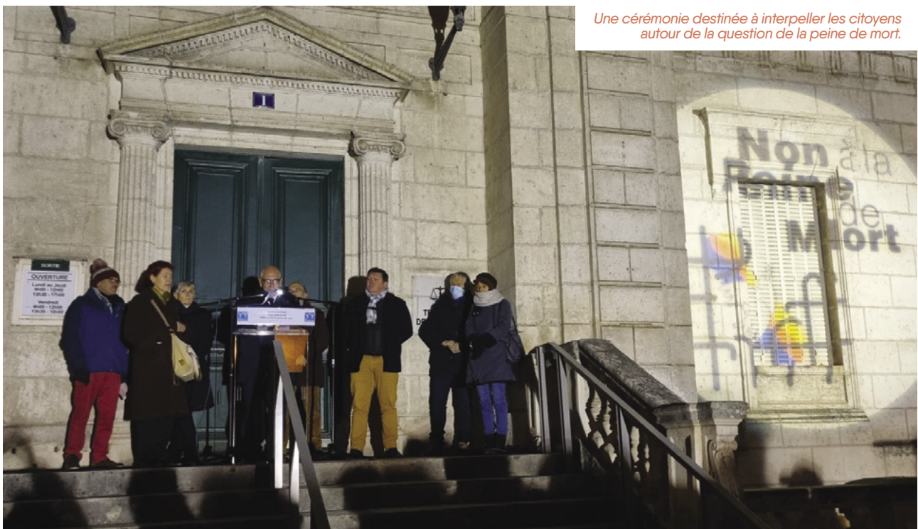
Une cérémonie destinée à interpeller les citoyens autour de la question de la peine de mort.

Après les autres prises de parole, la cérémonie s'est clôturée par une intervention théâtralisée et la chanson de Julien Clerc, « L'Assassin assassiné ». Cette manifestation sera reconduite chaque année.