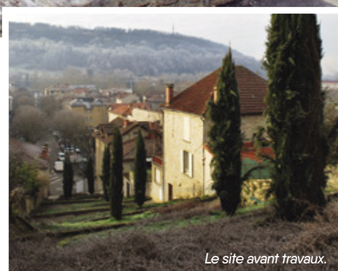
Le site avant travaux.

Après quelques mois de travaux, confiés aux entreprises Eiffage Energie, ID Verde et SAT, le site a retrouvé une « seconde jeunesse » suite à une requalification globale : des plantations repensées (vivaces, rustiques et résistantes) nécessitant moins d'entretien et d'arrosage, un éclairage led moins énergivore et mieux intégré , un cheminement piéton renoué et du mobilier urbain neuf (bancs et corbeilles à papier). A noter, l'intervention des services techniques municipaux pour le choix des végétaux et la mise en place du mobilier.