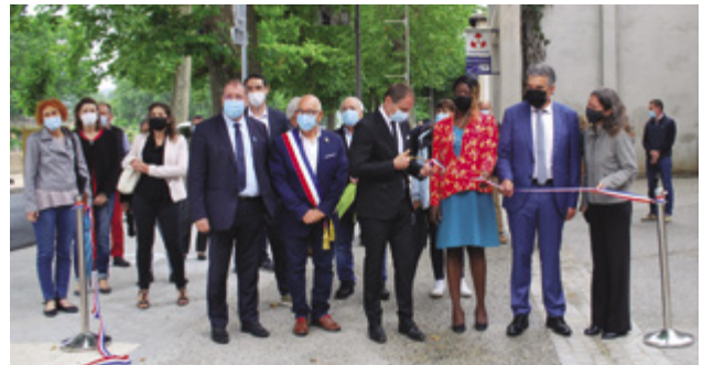
Inauguration du nouveau quai en présence de nombreux élus et des représentants des financeurs : le Président du Département, le Maire de Figeac, le Préfet et la Députée du Lot, le Vice-président de la Région.

(*) Opération Programmée d'Amélioration de l'Habitat et Renouvellement Urbain