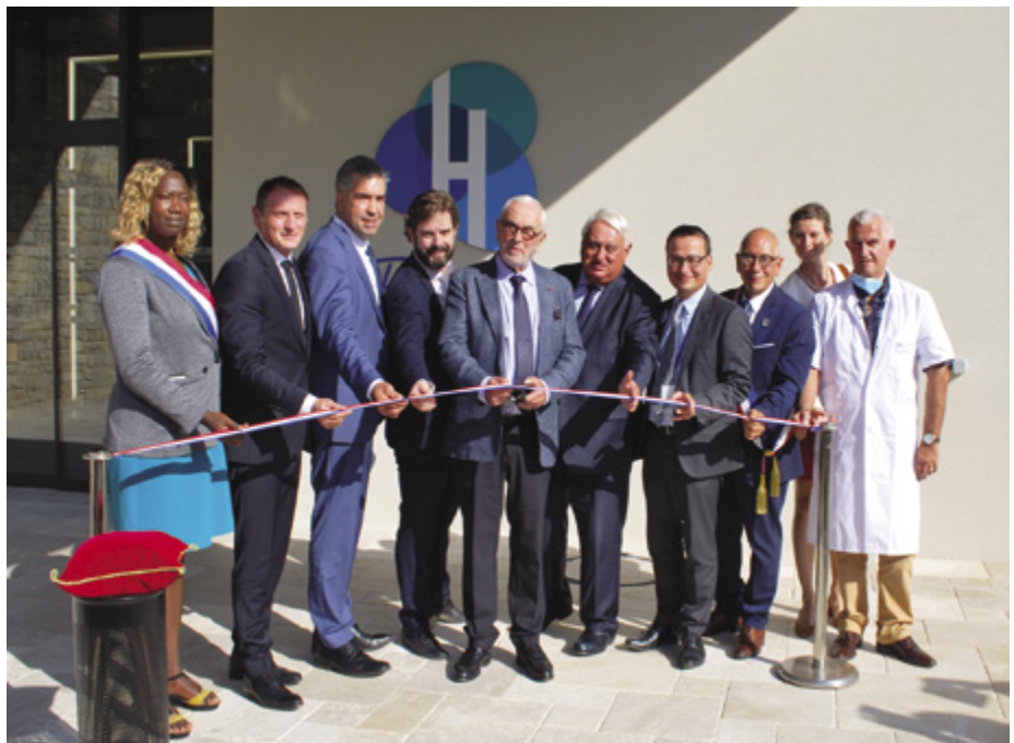
Martin Malvy, entouré des personnalités locales et financeurs, a inauguré le nouveau bâtiment de l'hôpital.