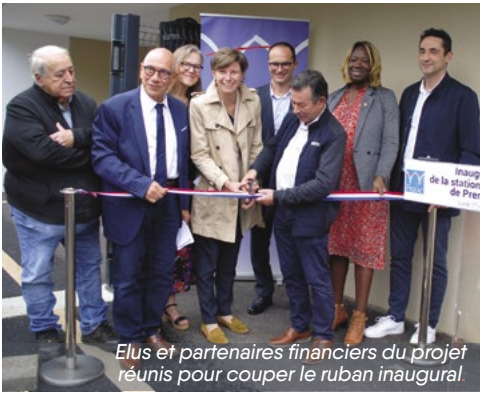
Elus et partenaires financiers du projet réunis pour couper le ruban inaugural.