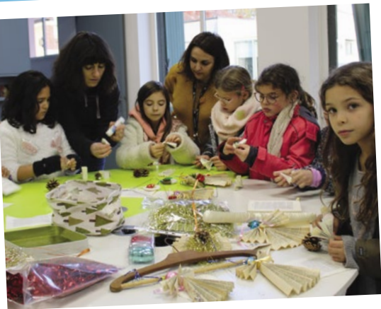
Activité récup' avec l'association Regain : les enfants apprennent à donner une seconde vie à des objets du quotidien