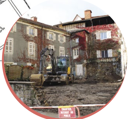
En lieu et place de la maison démolie, habitants et visiteurs profiteront bientôt d'un bel écrin de verdure.