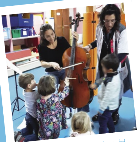
Éveiller les petits à la musique, ici autour du violoncelle présenté par une parent d'élève.