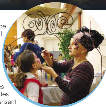
L'espace Mitterrand, temple du jeu durant 6 jours !

partenaires : l'Office intercommunal du Sport, le club Robotronik du lycée Champollion, l'Espace Jeunes ou encore le Centre Social et de Prévention de Figeac. L'affluence record et les retours très positifs des participants récompensent le travail de plusieurs mois et l'investissement de tous les animateurs présents.