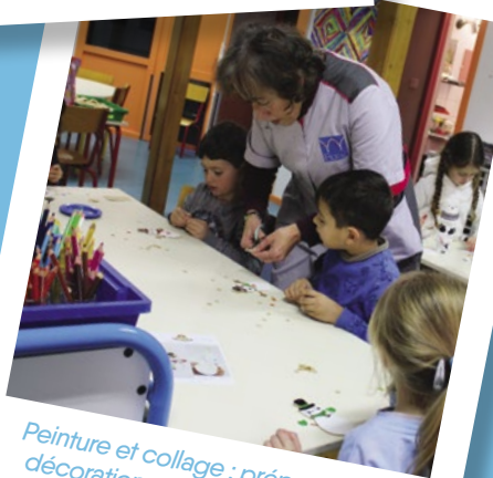
Peinture et collage : préparation de décorations qui viendront orner la table ou le sapin de Noël.