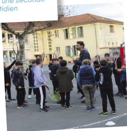
Les grands apprécient particulièrement les activités sportives (ici le tennis).