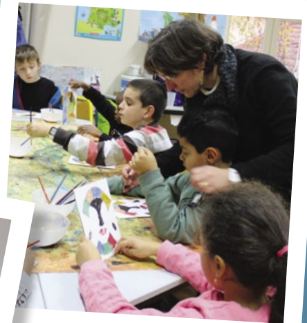
Pour les plus créatifs, l'activité sable coloré.