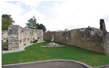
Avant / après : le lieu, propice au recueillement, est aujourd'hui plus accueillant pour les familles.