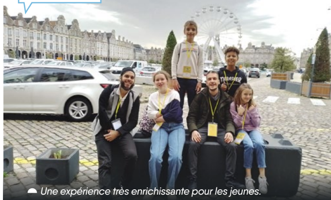
▲ Une expérience très enrichissante pour les jeunes.