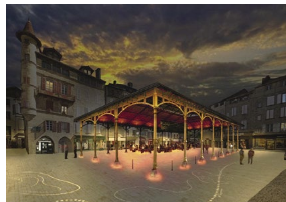
© perspective URBICUS – Cabinet MERLIN – QUARTIERS LUMIERES

la nouvelle place envisagée fin juin 2024. La réfection de la peinture de la halle est, quant à elle, envisagée au printemps 2024.