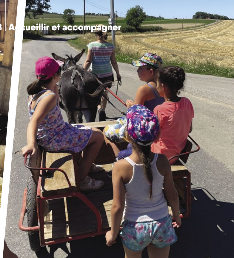
▲ Sortie familles à la ferme pédagogique du Marigot. Une journée plébiscitée par la trentaine de participants.