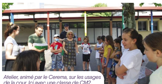
Atelier, animé par le Cerema, sur les usages de la cour. Ici avec une classe de CM2.

Les données récoltées serviront ensuite de base à Cerema pour élaborer les différents scénarii d'aménagements qui seront présentés au comité de pilotage début 2023.