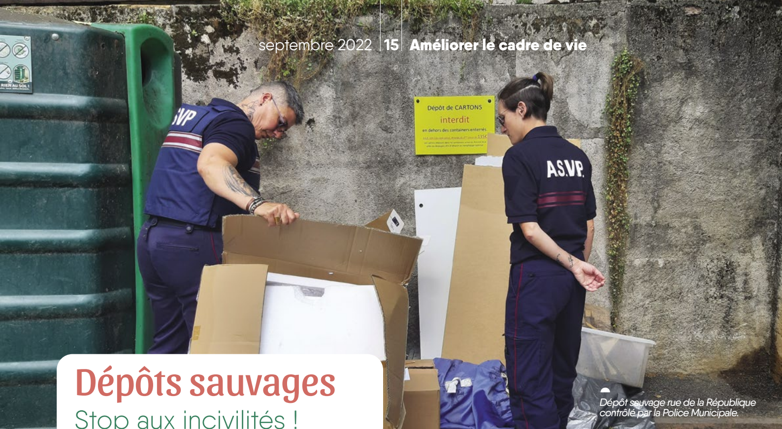
Dépôt sauvage rue de la République contrôlé par la Police Municipale.