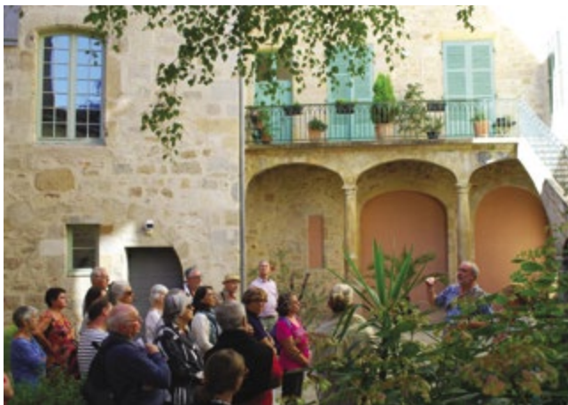
► Une très belle cour intérieure d'hôtel particulier dévoilée au public lors de la visite « En poussant les portes de la cité »

Durant deux jours, les visites guidées consacrées au bâti et à l'architecture, celles qui donnent accès à des édifices privés habituellement fermés au public, ou encore l'ouverture de monuments majeurs comme l'Hôtel de Salgues (sous-préfecture), l'Hôtel du Viguiier du Roy ou le Château de Ceint-d'Eau ont également très bien fonctionné, confirmant l'intérêt des visiteurs pour le patrimoine local.