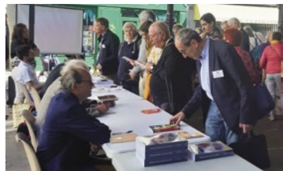
Autre temps d'échange, la séance de dédicaces organisée le dimanche matin, place Carnot. Les égyptophiles, passionnés ou amateurs, étaient au rendez-vous.