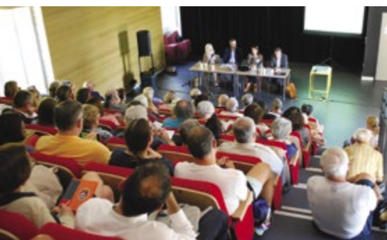
Les 9 tables-rondes ont fait le plein avec plus de 750 participants au total. Parmi les thèmes abordés : les pyramides, les rites et les fêtes, les animaux et les dieux ou encore le monde des morts.

Un pari ambitieux mais réussi à en croire les nombreux messages de participants reçus au lendemain de la manifestation. Des retours très positifs tant sur l'accueil et l'organisation que sur la qualité des conférenciers et des interventions proposées. Une satisfaction pour celles et ceux qui ont œuvré durant plusieurs mois en coulisses pour que l'événement soit un succès.