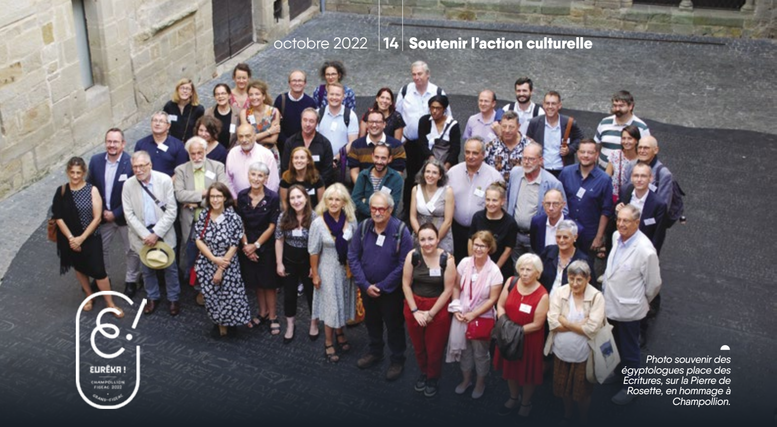
Photo souvenir des égyptologues place des Ecritures, sur la Pierre de Rosette, en hommage à Champollion.