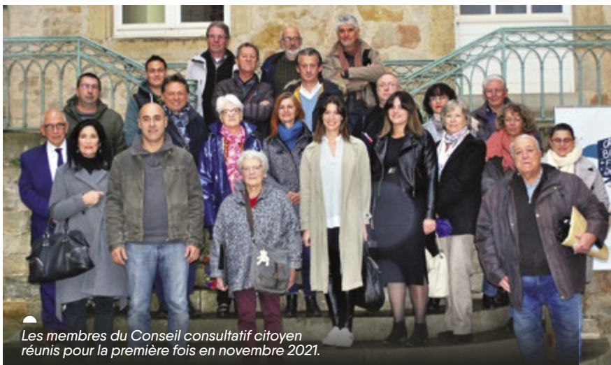
Les membres du Conseil consultatif citoyen réunis pour la première fois en novembre 2021.

Le Conseil consultatif citoyen de la Ville de Figeac est une assemblée citoyenne, officiellement installée en novembre 2021. Il est composé d'un groupe d'habitants représentatif de la population figeacoise, constitué à parité d'hommes et de femmes tirés au sort, pour moitié sur les listes électorales et, pour autre moitié, sur une liste de représentants proposés par les associations locales. Retour sur sa première année d'existence.