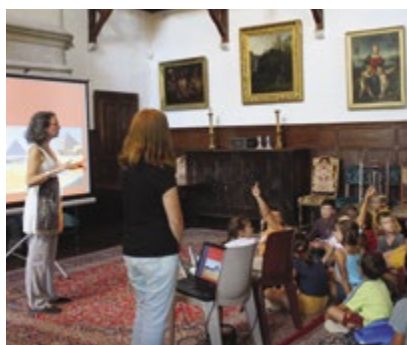
Plusieurs égyptologues sont allés à la rencontre des scolaires à Figeac, Cajarc, Assier, Latronquièrre et Bédouer : ici avec la classe de CE1-CE2-CM1 de l'école de Faycelles. Un auditoire attentif et très curieux.