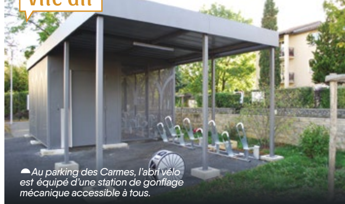
▲ Au parking des Carmes, l'abri vélo est équipé d'une station de gonflage mécanique accessible à tous.