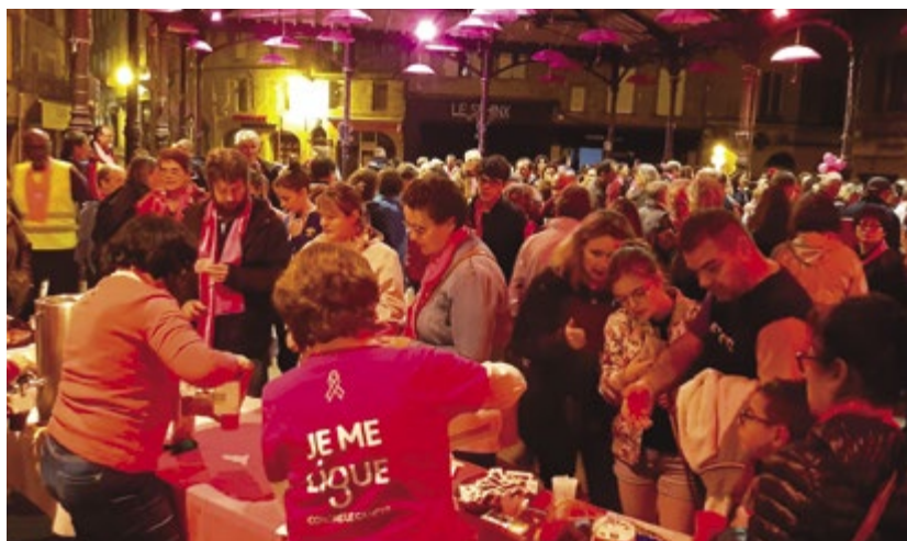
▲ Collation offerte aux participants de la Marche Rose. La forte mobilisation (331 personnes) a permis de collecter 1967 € au profit de la Ligue contre le cancer.

(* ) Le carcinome mammaire chez l'homme est exceptionnel mais existe : les cas représentent seulement 1 % du nombre total de cancers du sein et 0,5 % des cancers masculins.