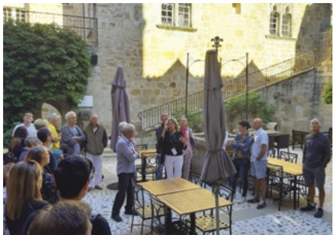
► Succès confirmé pour l'Hôtel du Viguiier du Roy, sa tour du XIV ème siècle, son jardin intérieur et ses façades sculptées datant du Moyen Âge.