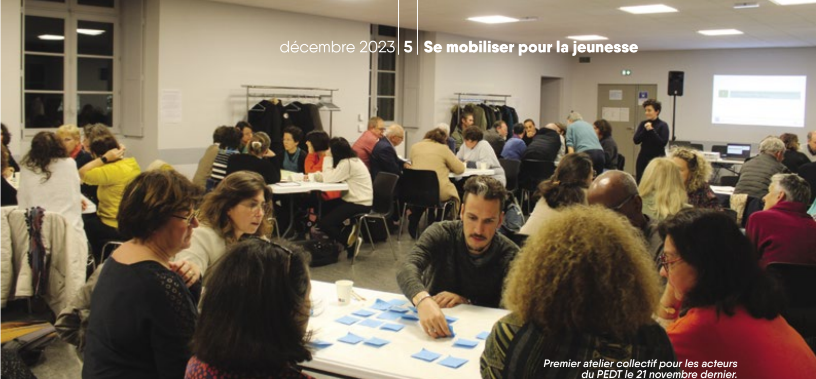
Premier atelier collectif pour les acteurs du PEDT le 21 novembre dernier.