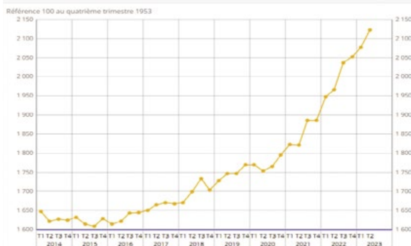
Indice du coût de la construction

Les contrats conclus par la Ville suivent des procédures nationales de marchés et de publicité très strictes , dans le respect de la transparence et de l'égalité des candidats. Chaque besoin est tout d'abord détaillé dans un cahier des charges qui fait l'objet d'une communication sur le site internet de la commune à partir de 25 000 € et dans les journaux officiels spécialisés (JAL, BOAM, JOUE) pour les montants plus élevés selon les caractéristiques du marché à passer (travaux, fournitures, services). A la fin de la période de consultation, la collectivité a accès aux offres déposées par les entreprises en ligne, sur une plateforme sécurisée. Ces offres sont ensuite analysées et notées par les techniciens de la collectivité selon les critères inscrits dans le cahier des charges. L'analyse est présentée pour avis à la commission des marchés publics composée d'élus de la majorité et