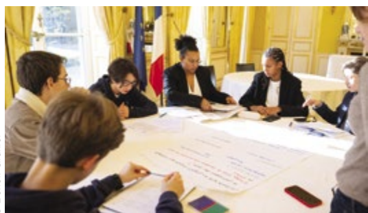
Les tables-rondes ont donné lieu à des échanges riches entre les jeunes élus.

(* ) Association nationale des conseils d'enfants et de jeunes. Les autres délégations : Strasbourg/ Schiltigheim, Issy-les-Moulineaux, Allonnes, Arras, Blagnac, Rumilly et Mamoudzou (Mayotte).