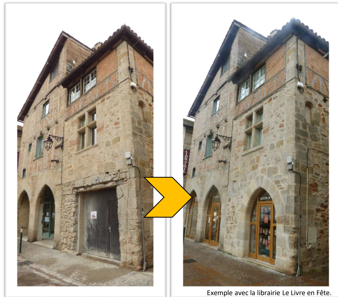
Exemple avec la librairie Le Livre en Fête.

Conseil municipal 2024 Ville de Figeac n°4 – 9 juillet 2024