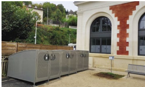
Le modèle sera identique à celui des box à vélos installés par la SNCF aux abords de la gare.

Cet investissement de 55 858 € HT sera financé à hauteur de 40 % dans le cadre du dispositif Alvéole + (**), générant un reste à charge pour la commune d'environ 33 500 €.