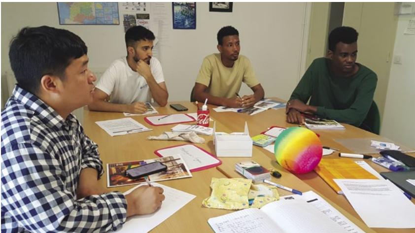
Atelier de français proposé aux résidents de l'HUDA (hébergement d'urgence pour demandeurs d'asile) par l'association Jamais Sans Toit 46.