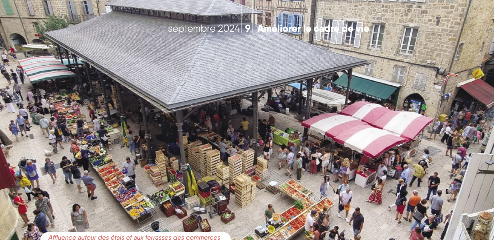
Affluence autour des étals et aux terrasses des commerces