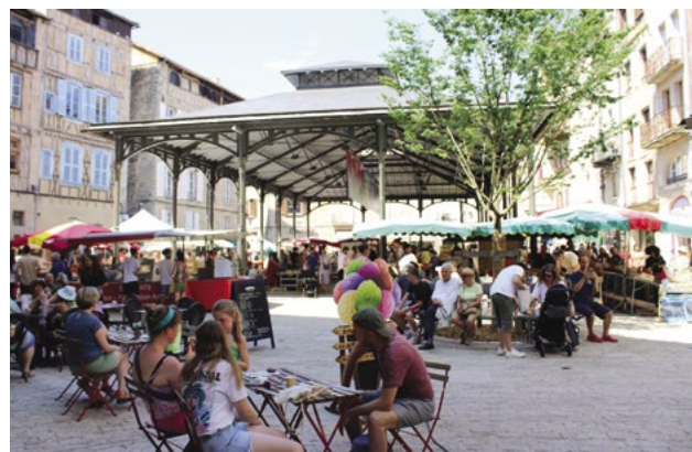
Autour de l'arbre, le banc circulaire est apprécié le temps d'une pause gourmande ou de retrouvailles entre amis.

Durant l'été, le crieur public avait lui aussi repris ses habitudes, interpellant les passants pour leur conter des anecdotes sur l'histoire de la ville ou annoncer les festivités à venir.