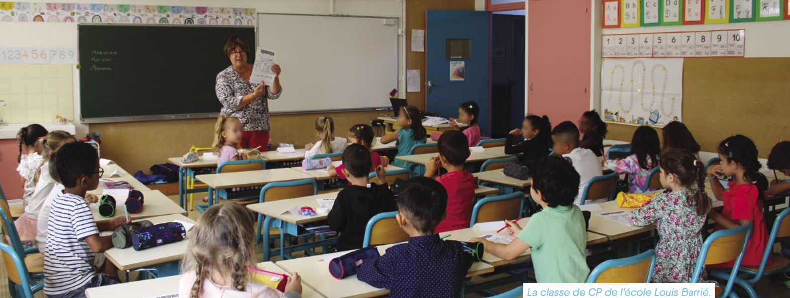
La classe de CP de l'école Louis Barrié.