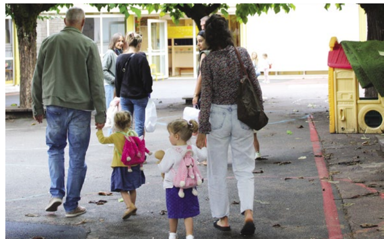
Cette année, les écoles publiques figeacoises comptent 192 élèves en maternelle et 344 en élémentaire.

En parallèle, certains travaux ont été confiés à des entreprises : réfection de la peinture et modernisation de l'éclairage (remplacement des néons par des pavés Led) dans plusieurs classes. L'opération la plus importante concerne l'extension et la mise aux normes de la zone de préparation des repas de l'école Louis Barrié. Le chantier, qui a débuté en août, se poursuivra jusqu'en décembre sans gêner la continuité du service sur place qui sera assuré normalement.