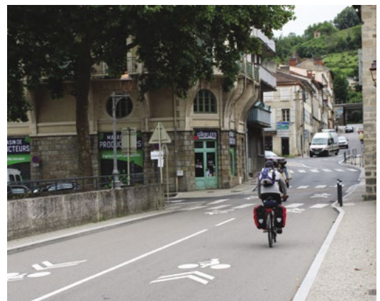
A la sortie du pont Gambetta, la rue du Griffoul est désormais matérialisée en « zone de rencontre » où la circulation est partagée.

Pour la liaison 1, la matérialisation au sol sera réalisée dans un premier temps sur la portion des allées Victor Hugo jusqu'au carrefour du pont du Pin. La suite de l'itinéraire sera traitée dans le cadre des travaux de réaménagement du site du Surgiè.