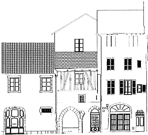
LOT - FIGEAC - 10 RUE DE CLERMONT FAÇADE RUE SUD P. WEILER Article 901 bis (1) DPA février 2022 P. WEILER - ARCHITECTE DPLG/DCS/HCMA/DAAP