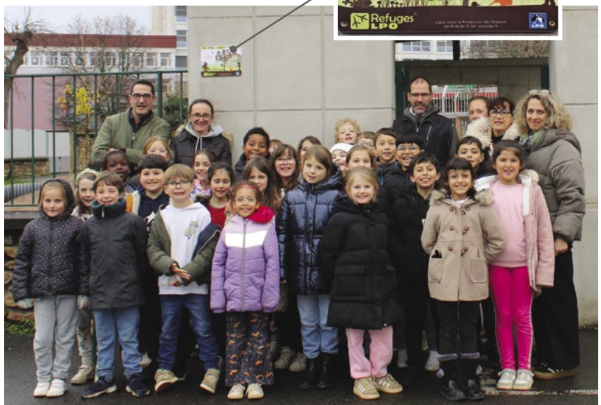
Les élèves et leurs enseignantes posent fièrement devant le panneau installé à l'entrée de l'établissement début décembre.