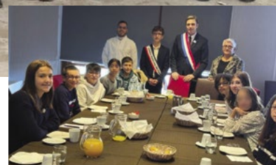
Une rencontre conviviale autour d'un petit-déjeuner à l'invitation du sénateur.

Les jeunes sont rentrés à Figeac la tête remplie de souvenirs : les visites de sites prestigieux, l'hébergement en auberge de jeunesse, les déplacements en métro et les moments de détente dans plusieurs hauts lieux de la capitale comme le Jardin des Tuileries, celui du Luxembourg ou encore le Champ de Mars avec la vue imprenable sur la Tour Eiffel.