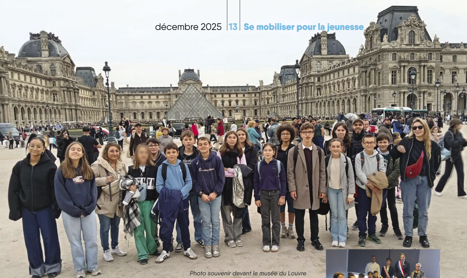
Photo souvenir devant le musée du Louvre