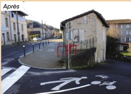
Au débouché de la rue du Griffoul, le trottoir est aujourd'hui une « voie partagée » accessible aux piétons et aux vélos.