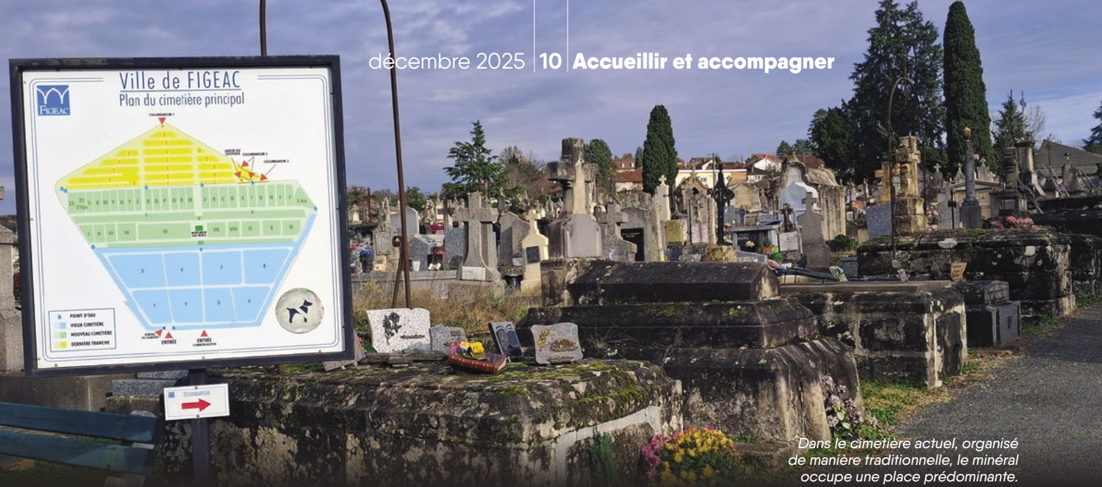
Dans le cimetière actuel, organisé de manière traditionnelle, le minéral occupe une place prédominante.