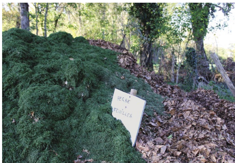
A Londieu, l'un des 5 sites de stockage dédié au compostage.

Les services continuent à rechercher des solutions techniques et rationnelles pour parvenir à valoriser 100% des feuilles.