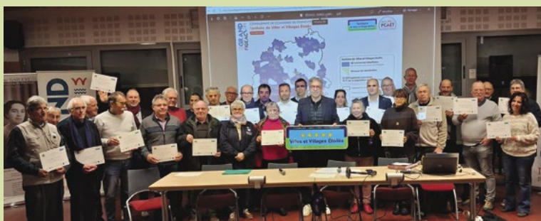
Les représentants des communes labellisées.