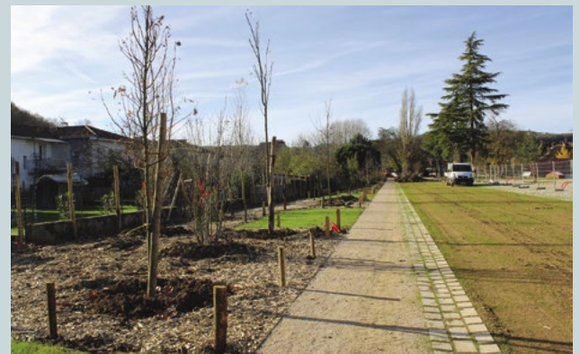
En bordure des parcelles riveraines, des arbustes fruitiers constituent un léger écran végétal.

Progressivement, la plaine des Pratges poursuit sa transformation. Depuis quelques jours, le site est accessible au public. Les dernières plantations et l'installation du mobilier urbain s'effectueront dans les prochains mois.