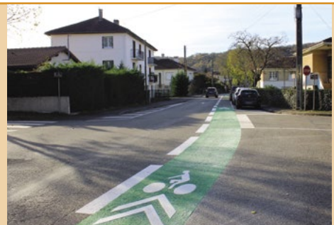
Ici, au croisement entre l'avenue Pierre et Marie Curie et la rue Paulin Ratier.

Pour sécuriser la circulation des cyclistes, la peinture blanche des marquages au sol a récemment été refaite sur les trois liaisons cyclables. De plus, sur certains itinéraires, la signalétique a été renforcée par une peinture de couleur verte afin de mieux matérialiser les croisements et inciter les automobilistes à être vigilants.