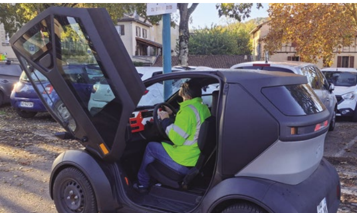
Deux VELI ont été testés par les agents : la Mobilize Duo pouvant rouler jusqu'à 80km/h, la Citroën Ami limitée à 45 km/h.