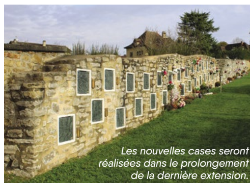
Les nouvelles cases seront réalisées dans le prolongement de la dernière extension.

En parallèle, afin de répondre à l'évolution des mentalités et des pratiques funéraires, le cimetière s'est doté, il y a plus de 20 ans, d'un premier columbarium de six emplacements, où sont conservées les urnes cinéraires et d'un jardin du souvenir, où peuvent être dispersées les cendres. Après plusieurs extensions (2005, 2009, 2012 et 2021), 10 cases supplémentaires vont très prochainement être construites en prolongement de la dernière tranche portant le total à 144 emplacements.