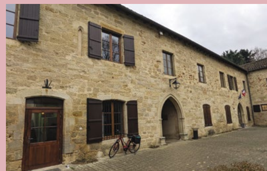
Les bureaux, accessibles pour les personnes à mobilité réduite, sont au 1er étage. Une sonnette avec interphone est installée à l'entrée.

Lundi : uniquement accueil téléphonique et rendez-vous Mardi : 9h-12h et 14h-17h Mercredi et vendredi : 14h-17h Jeudi et samedi : 9h-12h Tel : 05 65 50 07 69