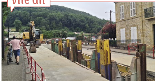
Le chantier fin mai.