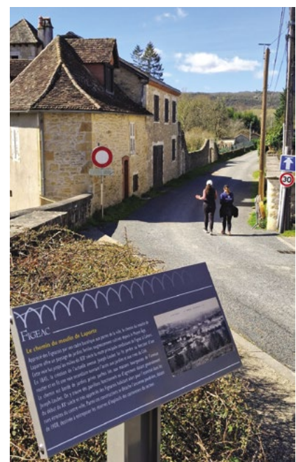
Ici le pupitre situé à l'entrée du chemin du moulin de Laporte.

Les quatre sites sélectionnés évoquent une mémoire récente, des aménagements qui ont transformé la ville et montrent son évolution ces dernières décennies.