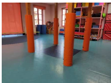
La salle de motricité