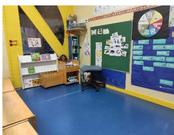
La classe 1