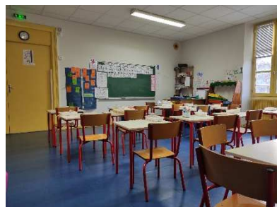
La classe 2