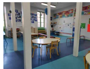
La classe 3