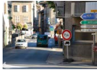
SCHÉMA COMMUNAL DE DÉPLACEMENTS URBAINS

Des locaux modernes et fonctionnels pour le bien-être des résidents. PAGE 5