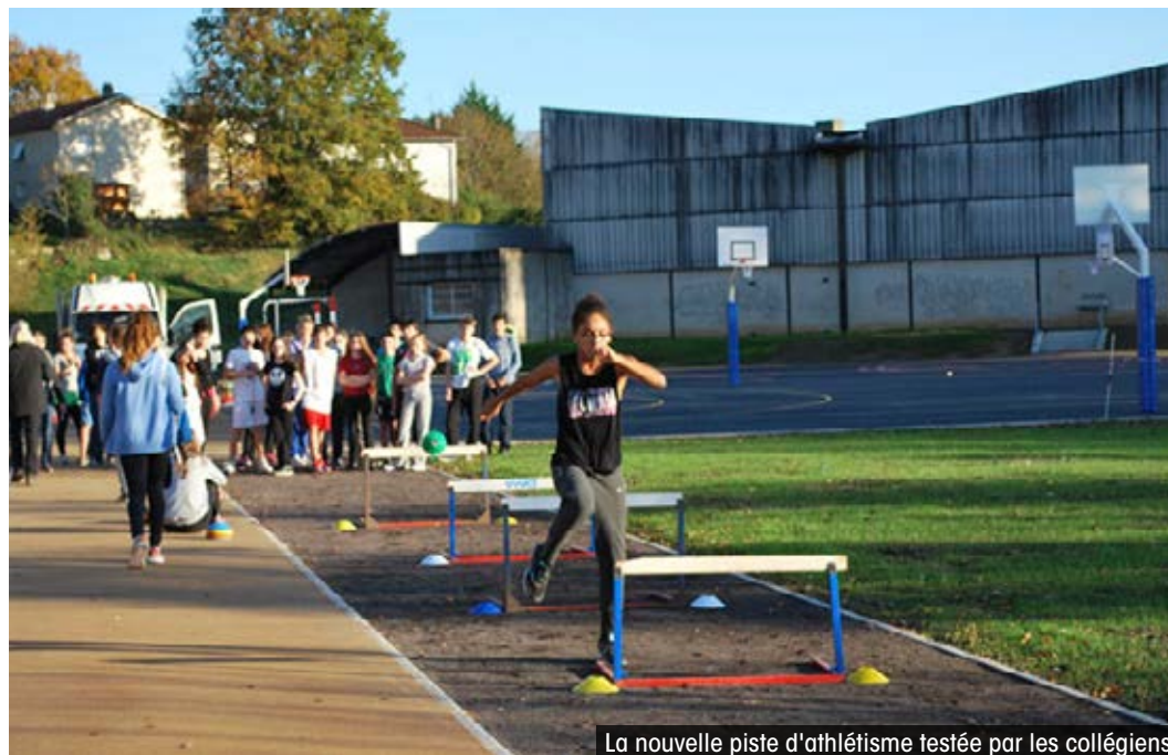
La nouvelle piste d'athlétisme testée par les collégiens

Un plateau sportif entièrement rénové et ouvert aux associations sportives