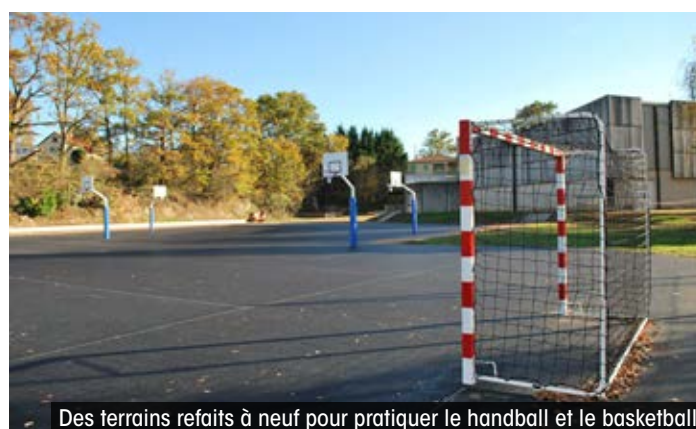
Des terrains refaits à neuf pour pratiquer le handball et le basketball

Des installations dont les clubs d'athlétisme, de handball et de basketball peuvent également profiter dans le cadre de leurs entraînements. En effet, la priorité est donnée au collège, mais en dehors du temps scolaire, la Ville, en lien avec l'Office Intercommunal du Sport, met l'ensemble du complexe sportif (gymnase, terrains et pistes extérieurs) à leur disposition.