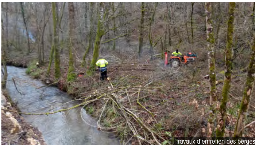
Travaux d'entretien des berges

Le ruisseau de Planioles, nommé localement ruisseau des Carmes ou de la Curie, draine un bassin versant de 1189 ha. Il prend sa source sur la Commune de Cardaillac et rejoint le Célé dans Figeac au niveau du pont du Gua, après avoir parcouru près d'un kilomètre en souterrain depuis l'avenue des Carmes. Depuis quelques mois, le Syndicat mixte du bassin de la Rance et du Célé (SmbRC) effectue des travaux sur la partie naturelle du cours d'eau en amont de la Curie. De son côté, la Ville de Figeac réalise actuellement des aménagements sur sa partie couverte.