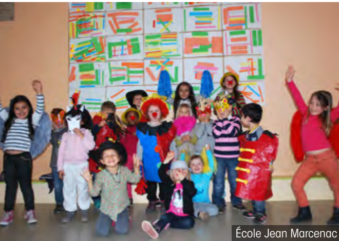
École Jean Marcenac