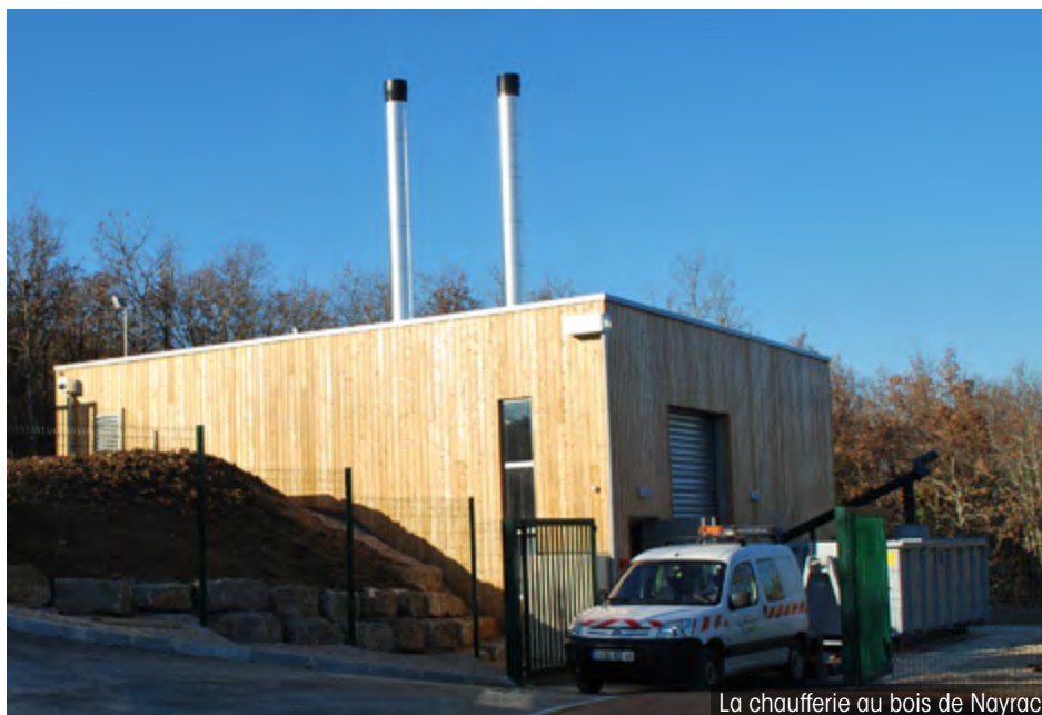
La chaufferie au bois de Nayrac