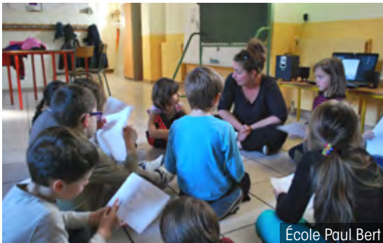
École Paul Bert

■ Dans les écoles élémentaires, les activités sont encadrées par différents partenaires associatifs et institutionnels (Fédération Partir, clubs membres de l'Office Intercommunal du Sport, Musée Champollion, service Patrimoine, A tous Sciences, l'Outil en Main...). Les enfants s'initient aux expériences scientifiques, au chant, à l'expression scénique, au cinéma et aux trucages, aux arts graphiques, aux jeux de construction, au modelage, au bricolage et pratiquent de multiples disciplines sportives.