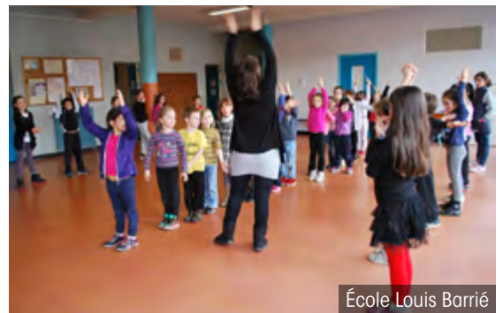
École Louis Barrié

■ Dans les écoles maternelles, les activités sont animées principalement par le personnel municipal autour d'activités manuelles (ateliers de décoration de Noël, masques de Carnaval...) et de jeux d'extérieur. Les enfants de Jean Moulin vont également à la rencontre des personnes âgées de la Résidence Ortabadial pour échanger. Ponctuellement, les plus jeunes découvrent l'éveil corporel, l'art visuel, les jeux de société ou encore une activité autour du poney grâce à des intervenants extérieurs.