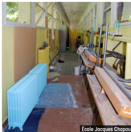
École Jacques Chapou