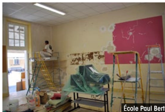
École Paul Bert

Selon les besoins recensés auprès des directrices, un complément ou remplacement de mobilier et matériel informatique est régulièrement effectué. Cette année, la Ville a fait l'acquisition de trois nouveaux TBI , un par école élémentaire, ce qui portera le nombre à 6 pour l'école Chapou, 3 pour Paul Bert et 3 pour Louis Barrié.