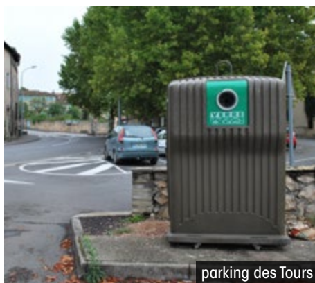
parking des Tours