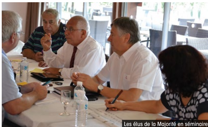
Les élus de la Majorité en séminaire

Ce travail, mené en commun, a permis de définir 3 piliers thématiques qui constitueront les bases de l'agenda 21 de la Ville de Figeac et qui, par définition, devront répondre à la réflexion environnementale et participative :