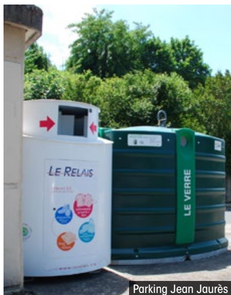
Parking Jean Jaurès

Pour les TLC, 32 tonnes ont été collectées sur les 6 premiers mois de l'année 2015.