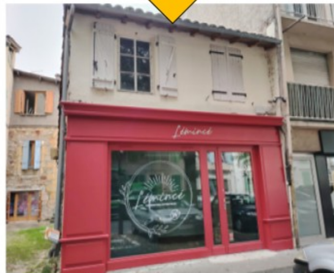
Exemple avec L'émincé au boulevard G. Juskiewenski.