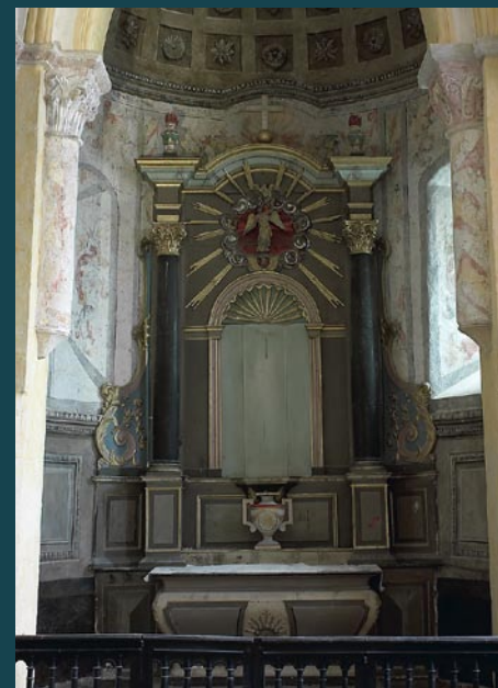
Le retable en 2003

Ces restaurations ont été financées par la Ville de Figeac, la DRAC Midi-Pyrénées, la Région Midi-Pyrénées et le Conseil général du Lot.