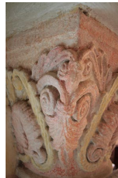
Chapiteau du XIII e siècle de tradition romane à l'entrée de la chapelle, repeint au XVII e siècle